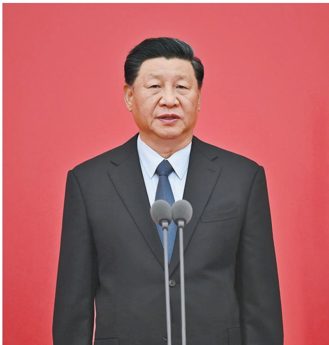
8月26日,中共中央总书记、国家主席、中央军委主席习近平向中国人民警察队伍授旗并致训词。