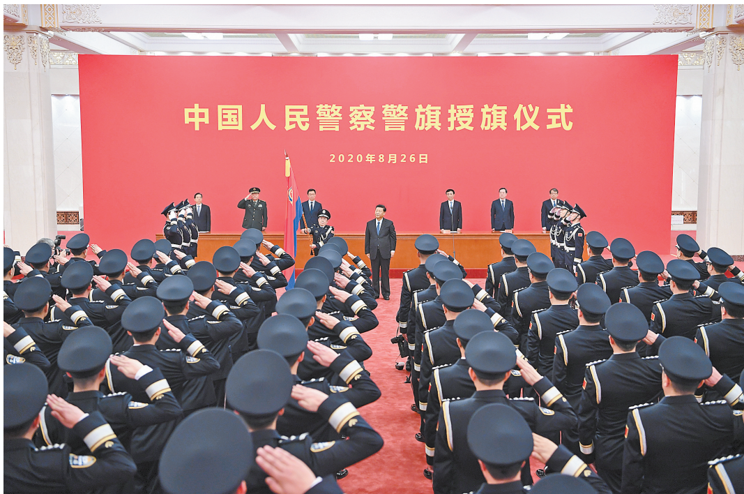
8月26日,中共中央总书记、国家主席、中央军委主席习近平向中国人民警察队伍授旗并致训词。

新华社北京8月26日电 中国人民警察警旗授旗仪式26日在人民大会堂举行。中共中央总书记、国家主席、中央军委主席习近平向中国人民警察队伍授旗并致训词,代表党中央向全体人民警察致以热烈的祝贺。他强调,我国人民警察是国家重要的治安行政和刑事司法力量,主要任务是维护国家安全,维护社会治安秩序,保护公民人身安全、人身自由、合法财产,保护公共财产,预防、制止、惩治违法犯罪。新的历史条件下,我国人民警察要对党忠诚、服务人民、执法公正、纪律严明,全心全意为增强人民