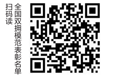
全国双拥模范表彰名单 扫码阅读

彰为全国爱国拥军模范个人。昆明市等4个单位在北京主场接受颁奖,其余11个单位和个人代表在云南分会场接受颁奖。