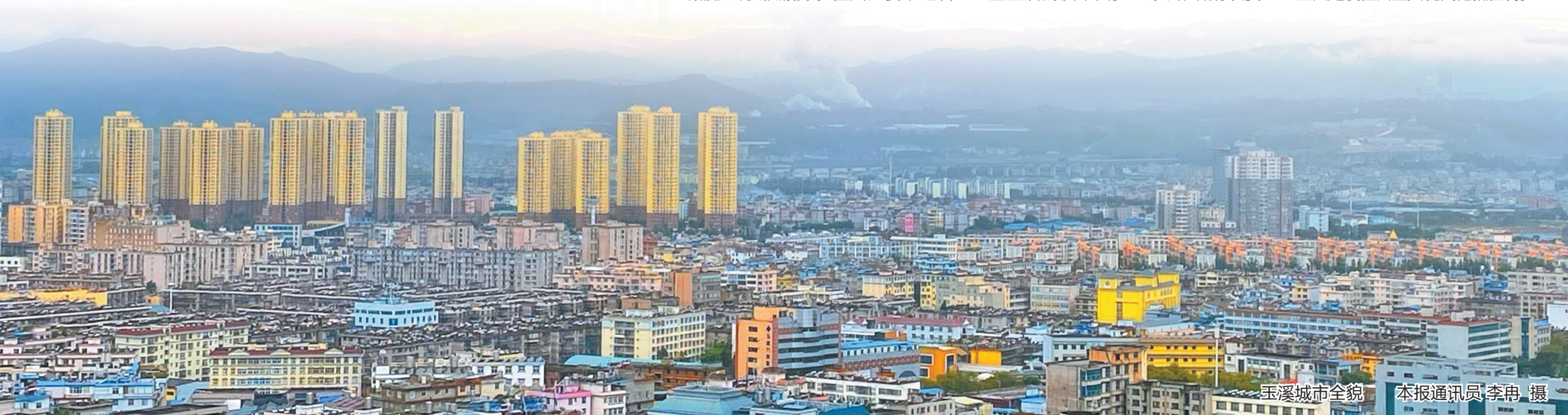
玉溪城市风貌