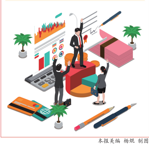
本报美编 杨焜 制图