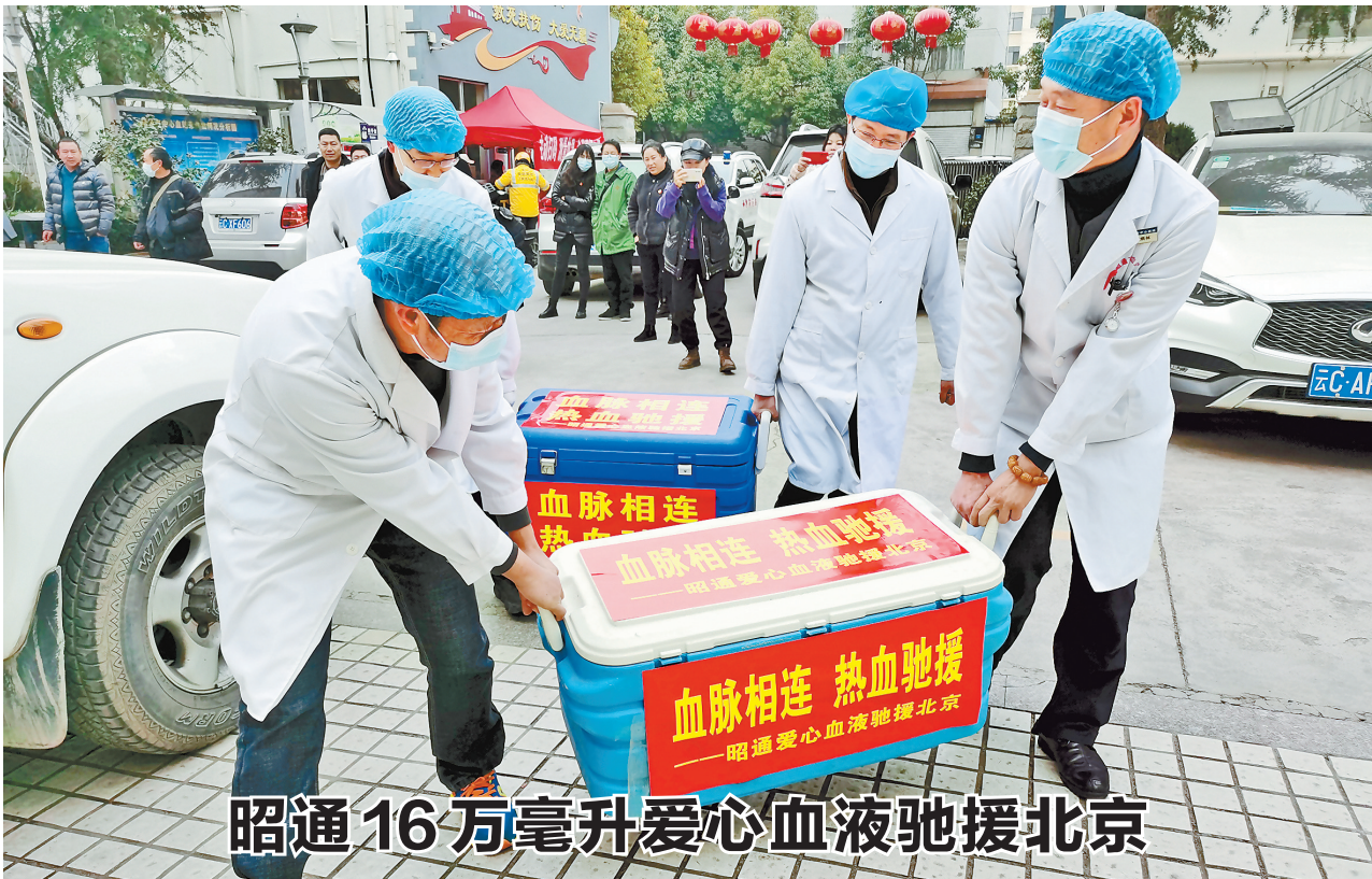
昭通16万毫升爱心血液驰援北京

我省统筹部署2020年河(湖)长制工作,修订印发河(湖)长制省级会议等4项制度及省级河(湖)长巡查等4项办法,深入推进河湖“清四乱”专项行动常态化、制度化,扎实开展河湖管理范围划定工作,大力推动美丽河湖建设。推进九大高原湖泊“十三五”规划项目收官工作,全面完成九大高原湖泊保护条例修订工作,实现了“一湖一条例”。加强六大水系及骨干江河长制工作,建立健全与西藏、四川、贵州、广西周边省(区)联防联控工作机制,坚决打好以长江为重点的六大水系保护修复攻坚战,赤水河流域保护治理得到有效加强,长江“十年禁渔”纳入河长制考核内容。全省100个地表水断面水质及所有出境地表水断面水质均达到国家年度考核目标。