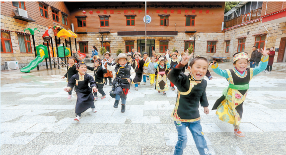
山南市隆子县玉麦乡小学的孩子正在开心地玩耍。

西藏自治区与尼泊尔、不丹、印度、缅甸等国接壤,边境线长达4000公里,有樟木、吉隆、普兰三个国家一类边境口岸,亚东乃堆拉贸易通道以及多个边贸市场和边民互市点。