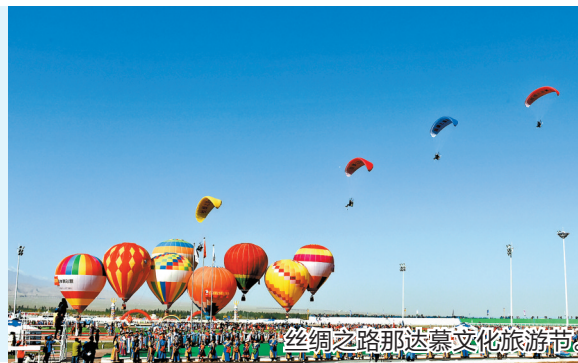
丝绸之路那达慕文化旅游节。

肃北蒙古族自治县北与蒙古国接壤,东与内蒙古自治区相连,西承新疆、南接青海,中蒙边境线长65.018公里,有蒙、汉、回、藏等11个民族。