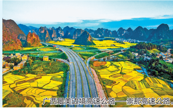
广西最美边境高速公路——崇那高速公路。

位于祖国西南边陲的广西,与越南接壤,是我国唯一与东盟陆海相连的省区。在长度超过1000公里的陆地边境线上,分布着8个边境县(市、区)。