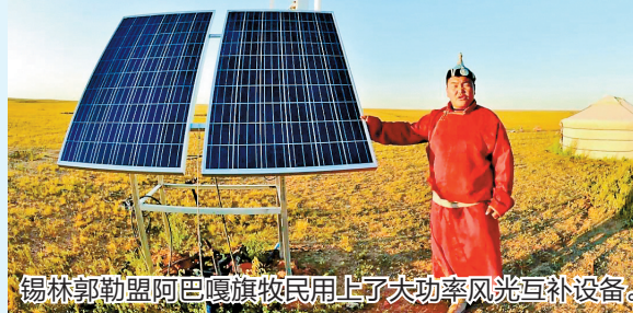
锡林郭勒盟阿巴嘎旗牧民用上了大功率风光互补设备。

内蒙古自治区毗邻俄罗斯和蒙古国,边境线长4200多公里,沿边一线共有20个边境旗市区,少数民族人口60.24万人。