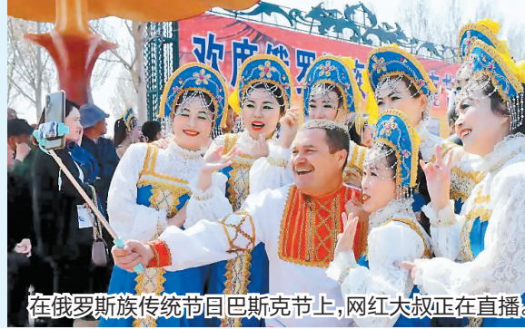
在俄罗斯族传统节日巴斯克节上,网红大叔正在直播。

黑龙江省边境线总长2981公里,沿边有18个县(市、区),面积14.9万平方公里。少数民族30个,人口30万,对俄贸易、农业等为主要产业。