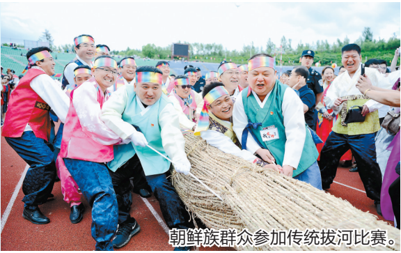
朝鲜族群众参加传统拔河比赛。

吉林省是一个多民族边疆省份,少数民族人口218.57万人。边境线总长1438.7公里,边境地区包括通化市、白山、延边朝鲜族自治州,有10个边境县(市、区)、45个边境乡(镇、街道),14个边境口岸。