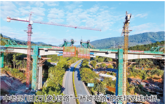
中老昆(明)万(象)铁路“一桥跨两路”的关双双线大桥。

云南与缅甸、老挝和越南三国接壤,边境线长4060公里,共有8个边境州(市)、25个边境县(市),边境县总人口697.5万人,少数民族人口占总人口的60%。