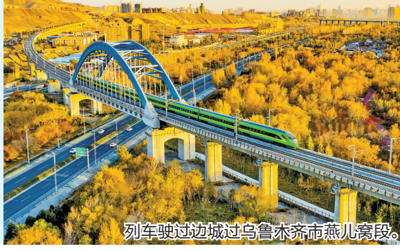
列车驶过边城过乌鲁木齐市燕儿窝段。

新疆东西驰骋2000公里、南北绵延1650公里,有166万平方公里的广袤土地,5700公里的边境线,是我国陆地面积最大、交界邻国最多、陆地边境线最长的省区,新疆之大,在大发展空间,大在未来前景。