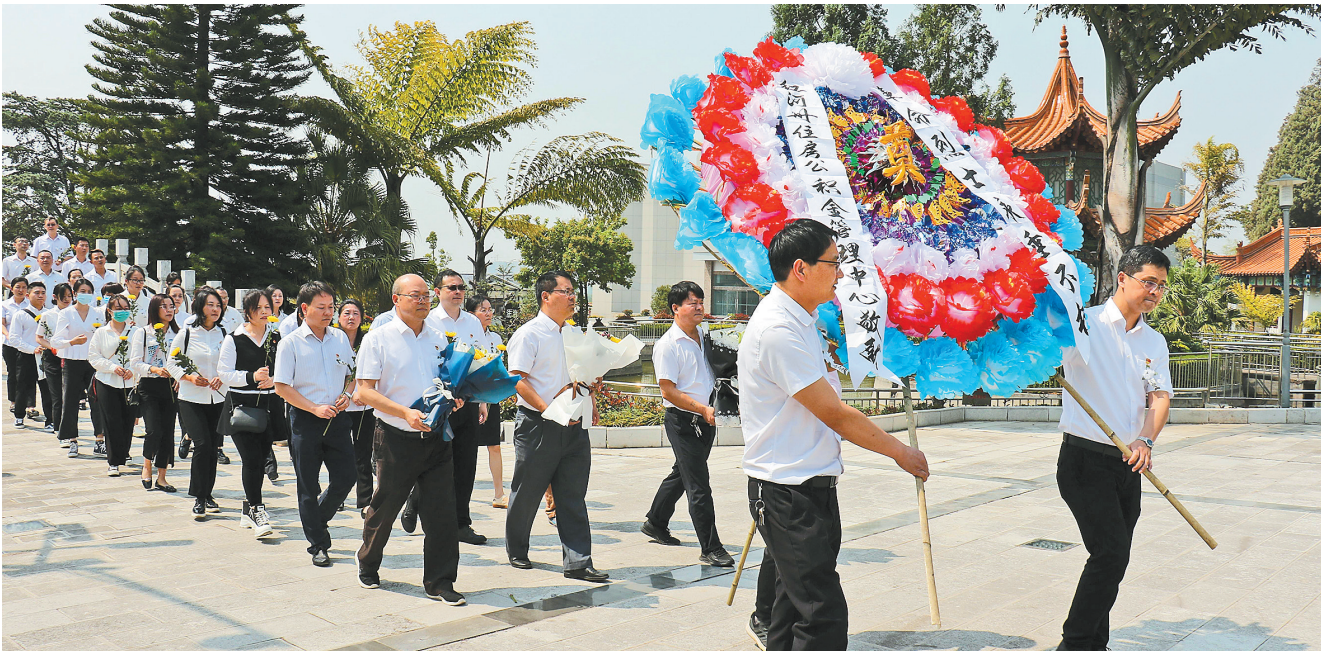
红河哈尼族彝族自治州干部职工在蒙自市烈士陵园开展“祭扫英烈、传承革命传统”活动。

4月1日,省林业和草原局将理论学习与主题活动有机结合,把党史学习教育的课堂搬到烈士陵园,在红色地标中致敬历史,在红色精神的谱系里接受洗礼,感受革命文化,筑牢家国情怀。大家