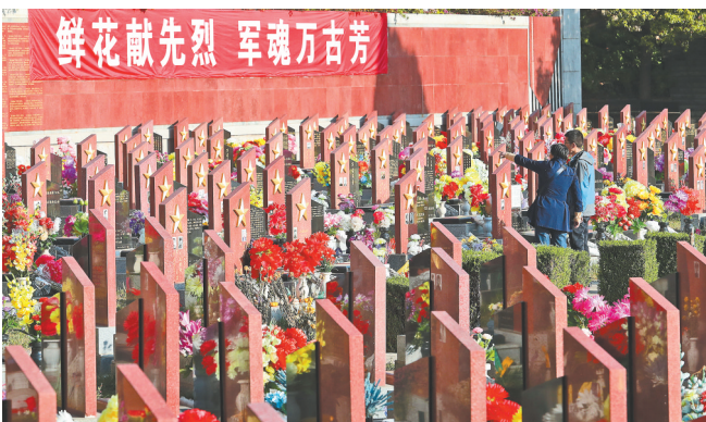
昆明市民在金山山艺术园林军魂园祭扫。

云南各地根据自身特点,挖掘红色资源,分别举行祭扫烈士陵园、参观革命遗址、宣讲先进事迹等活动,进一步弘扬红色文化,传承红色基因。