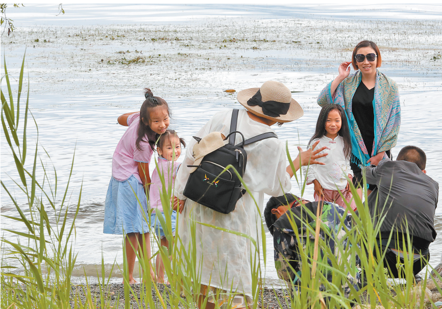
游人陶醉洱海风景