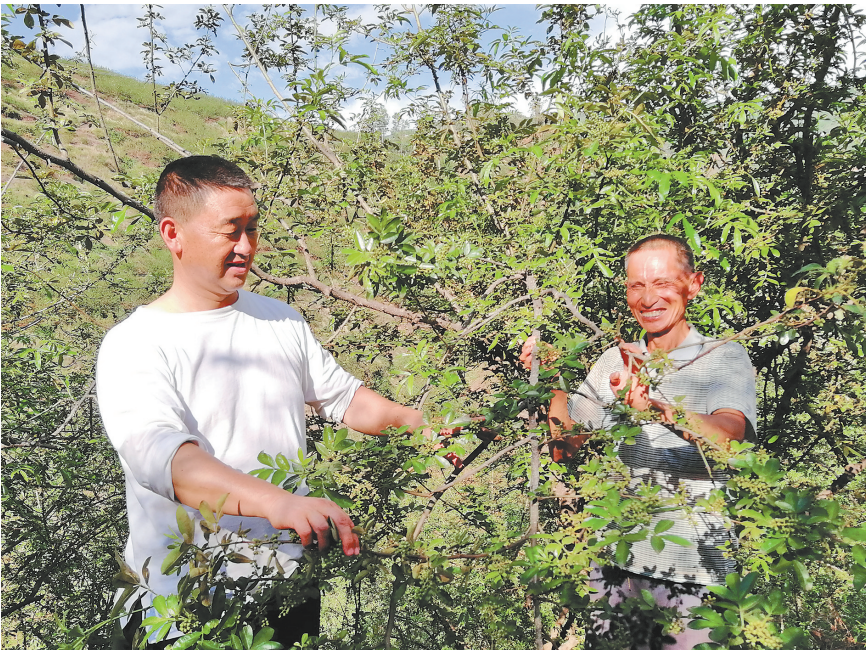
龙头山群众查看花椒长势