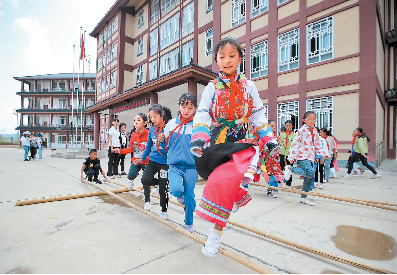
施甸县木老元乡布朗族学生学习民族传统体育

我省聚焦“发展教育脱贫一批”，全力推进贫困地区教育基础设施建设和教师队伍建设；打好控辍保学“组合拳”，确保“不让一个贫困家庭孩子失学辍学”；实施“推普攻坚”工程、“雨露计划”、智志双扶等系列有力措施，发挥教育对阻断贫困代际传递的重要作用，加快补齐教育发展短板。