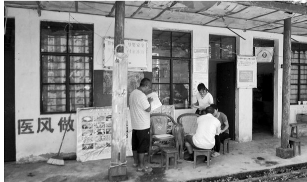
墨江县条件简陋的乡村卫生院

我省始终把产业扶贫作为脱贫攻坚的根本之策和长久之计，以产业扶贫筑牢脱贫攻坚持续增收的根基，编制实施产业扶贫规划，强化政策支持和资金保障，积极引导贫困地区群众转变生产方式和就业观念，推广先进适用技术提升贫困地区产业转型升级，着力推行以“党支部+龙头企业+合作社+基地+贫困户”为代表的产业扶贫新模式。“产业扶贫帮扶到户”彻底斩断穷根，产业就业持续赋能带领贫困群众共奔致富路。