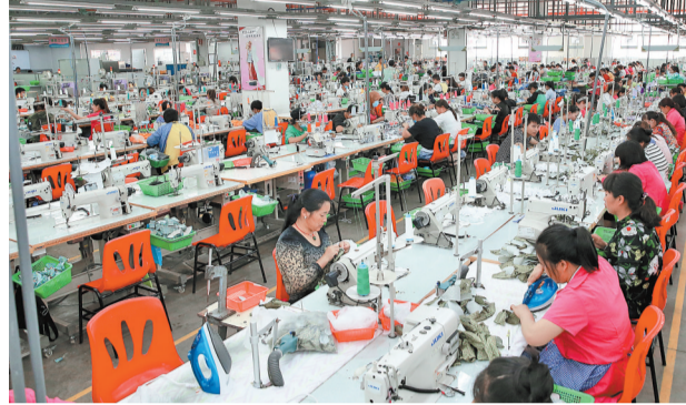
砚山县建立扶贫车间带动贫困群众就业增收