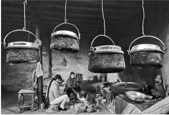
祥云县鹿鸣乡雄里村贫困群众的家

黑白与彩色影像的对比呈现，不仅反映了云南脱贫地区发生的历史性巨变，以及脱贫群众焕然一新的精神面貌，更见证了我省脱贫攻坚的伟大壮举和时代精神，展现了全省各族人民群众感恩、听党话、坚定不移跟党走，加快建设美丽幸福文明和谐新云南的美好图景。