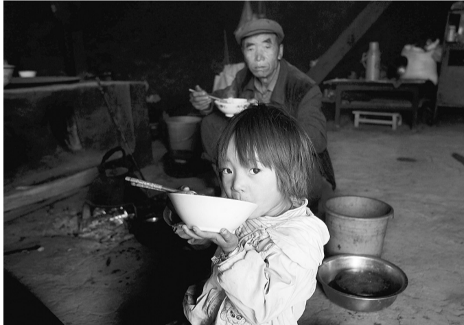
南华县贫困山区留守儿童