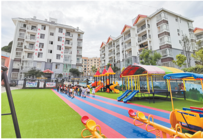
马关县易地扶贫搬迁集中安置点幸福社区