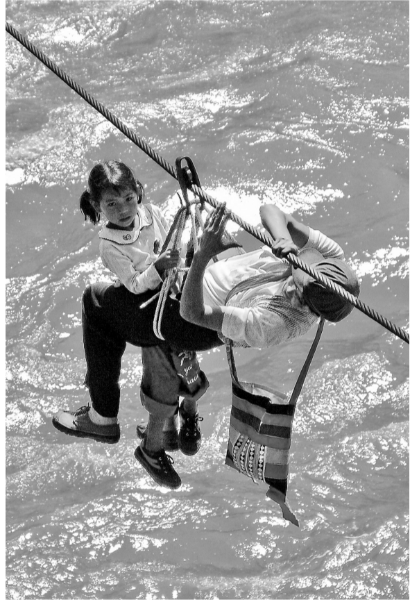
溜索曾是千百年来怒江群众过江的主要方式

全速、全力推进交通基础设施建设，助力决战脱贫攻坚，云南进入高铁时代，县城高速公路“能通全通”工程建设成效显著，“十三五”新增高速公路里程5000公里，基础设施建设实现历史性突破。