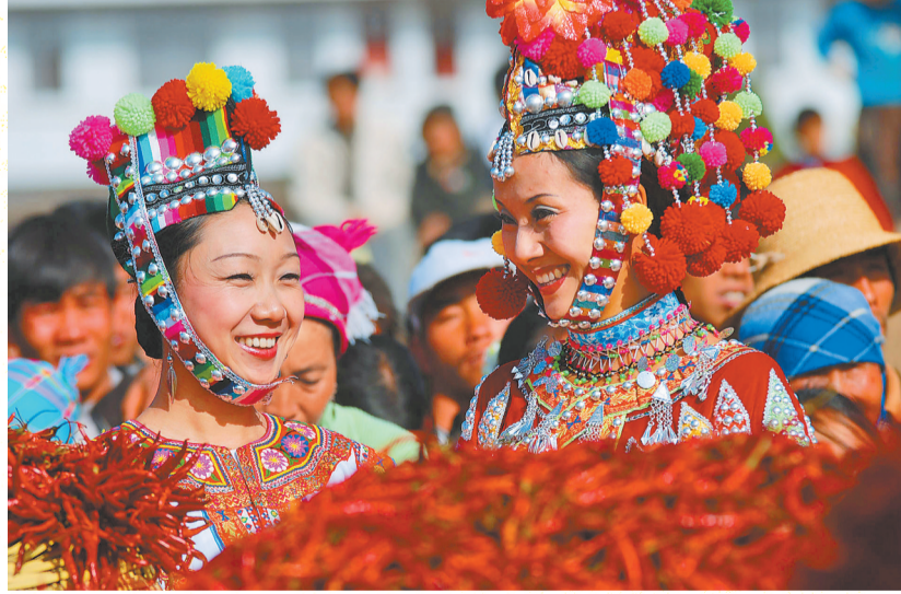
辣椒丰收，文山彝族姑娘脸上绽放笑容