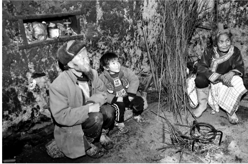
大关县上高桥乡大寨村斑鸠窝村民小组贫困群众家

我省11个“直过民族”和人口较少民族聚居区群众实现整体脱贫，实现社会形态和物质形态两个“千年跨越”。“好日子是干出来的”，脱贫攻坚不仅实现了增收致富，更唤醒了贫困群众对美好生活的追求，自立自信信心足，文明新风展新貌，携手共进奔小康，贫困群众精神面貌焕然一新。“脱贫不忘党中央，致富感谢共产党”成为各族人民的共同心声。