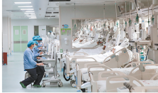
镇雄县人民医院开展远程医疗诊治