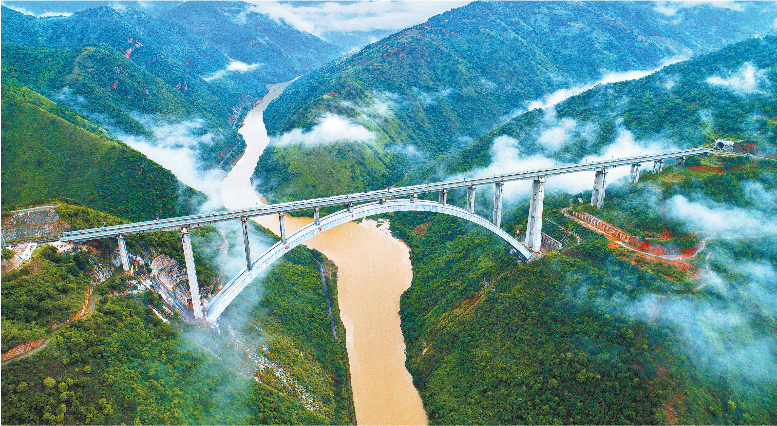
弥勒市和丘北县交界处的南盘江大桥

着力解决“生存难”是云南脱贫攻坚最难啃的一块硬骨头。作为全国农村危房数量最多、改造任务最艰巨的省份之一，我省坚持以脱贫攻坚统揽经济社会发展全局，把易地扶贫搬迁作为全省脱贫攻坚的“五个一批”和“头号工程”，“挪穷窝、谋出路”。通过全力抓好农村危房改造这一民生工程，解决了超过130万户约500万贫困群众的住房安全问题。