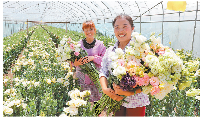
红河蒙自花卉产业助农脱贫