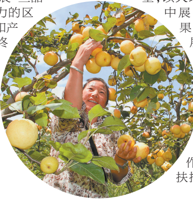
楚雄市吕合镇甘甜果业公司 带动群众发展优质梨种植