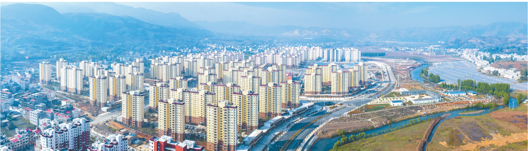
昭通市易地扶贫搬迁安置区靖安新区

春天的云南处处花团锦簇，生机盎然。 遍布全省的易地扶贫搬迁安置区“烟火气”十足，搬迁群众安居乐业为梦想打拼，在小康路上奋力前行。这一幅幅景象，彰显着云南上下一心接续奋斗、实现百万大搬迁的不凡历程，描绘了各族群众摆脱贫困、奔向幸福新征程的壮丽新篇。 5年来，作为全国脱贫攻坚主战场之一，云南深入贯彻党中央、国务院相关部署要求和习近平总书记两次考察云南重要讲话精神，将易地扶贫搬迁作为脱贫攻坚的“头号工程”，坚持“挪穷窝与换穷业并举、安居与乐业并重、搬迁与脱贫同步”，完成了云南历史上规模最大的百万人大搬迁，实现了“一步跨千年”的壮举，探索出了一条具有云南特色的搬迁脱贫新路，成为云南乃至中国减贫史上的“扶贫奇迹”。