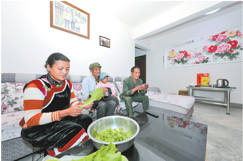
怒江州易地扶贫搬迁群众搬入新居，开启新生活

迁，仅用1年多时间就建成67个集中安置点，占全州总人口五分之一的10万贫困群众搬出大山，住进了宽敞明亮的安置房，实现从农耕文明向现代文明转变。 如今的托坪村，一栋栋整洁的楼房耸立江边，配套设施一应俱全，特色产业红火，群众家门口稳定就业，托坪村成了名副其实的“脱贫村”。不仅如此，怒江州通过实施教育扶贫，帮助2000多名失学、辍学孩子重返校园，斩断了贫困代际传递。群众学会了种植养殖技术，掌握了一技之长，思想教育帮助群众转变观念，内生动力不断增强。 一片片拔地而起气势恢宏的安置房，一张张搬迁群众幸福欢乐的笑脸，一幅幅安居乐业美好生活的景象，成为云南易地扶贫搬迁成果的真实写照。从故土难离到安居乐业，从靠山吃山到勤劳致富，各族群众摆脱了祖祖辈辈“一方水土养不好一方人”的困境，奔向幸福新生活。