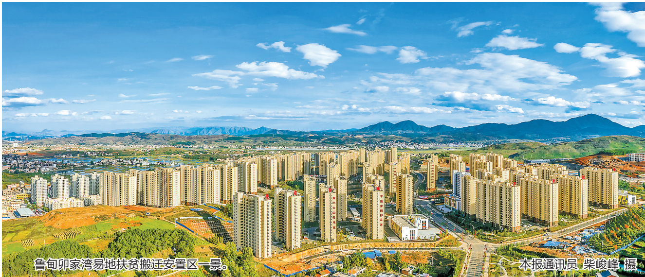
鲁甸卯家湾易地扶贫搬迁安置区一景。