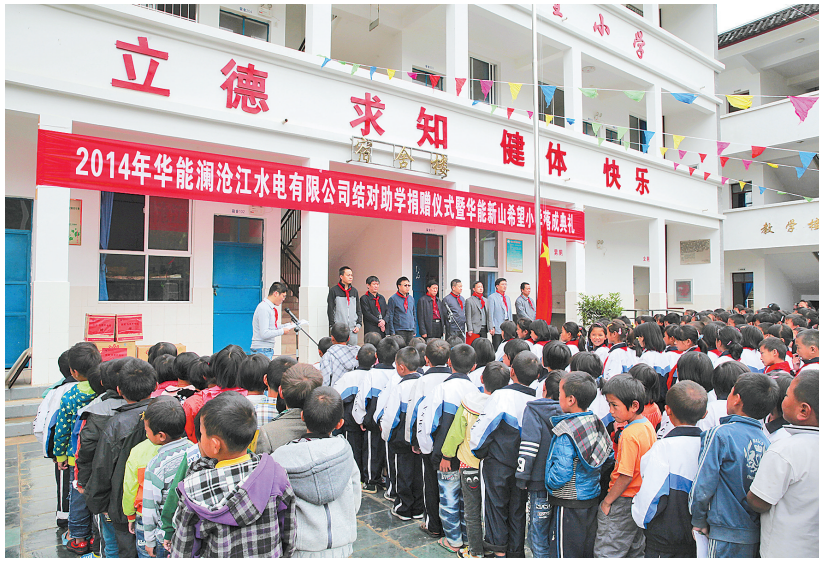
位于云龙县功果桥镇的华能新山希望小学

1999年,小湾工程开始筹建,第一批澜沧江人翻越重山进驻澜沧江。除了地势的险要,展现在这群水电人眼前的是闭塞之下的贫困与落后,这群人立志要以大项目带动地方经济发展,助力群众脱贫。电站建设过程中,随着员工与地方百姓的不断接触,员工自发、自觉地开始了对周边贫困群众的帮扶。 2006年,云南昆明,一场签约仪式引发关注。中国华能集团与云南省政府签署了《关于加快澜沧江水电开发的会谈纪要》,全力支持云南省清洁能源开发建设,同时以解决民生难题为重点实施“百千万工程”,重大项目的落定成为了闭塞落后贫困地区发展的契机,“百千万工程”的实施,正式拉开了澜沧江公司扶贫援助的序幕。