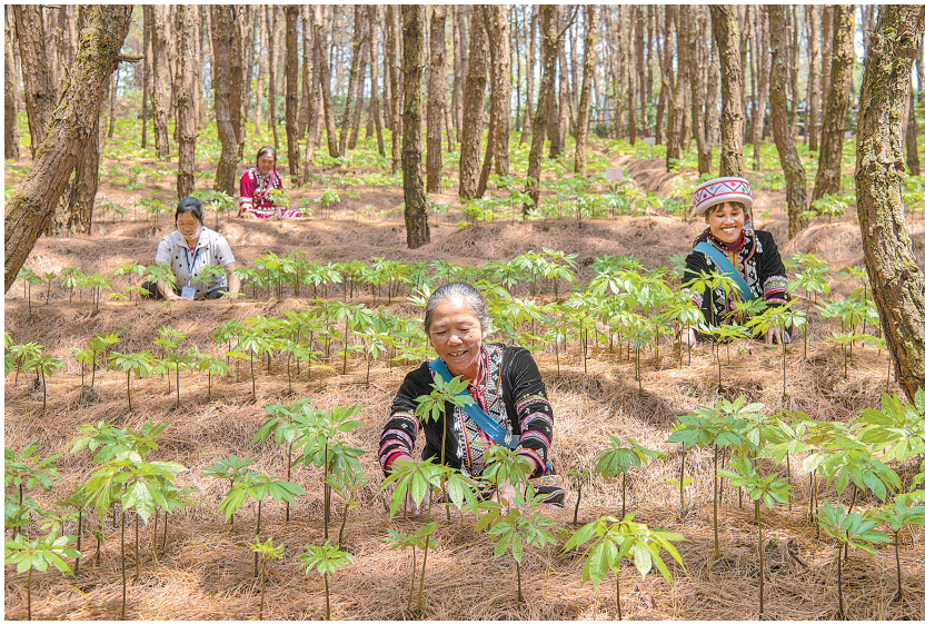
与朱有勇院士团队跨界合作开展林下三七种植项目

实施产业帮扶,按照“宜种则种、宜养则养”的原则,有效推动云南绿色农业产业发展,不断壮大农村集体经济,真正帮助贫困群众多元增收。在澜沧拉祜族自治县木戛乡,根据当地实际,投入华能帮扶资金840.4万元,以“集团+企业+村级合作社+农户”的肉牛养殖发展模式,引进企业,以“借母还续”的方式,为农户提供华能帮扶资金、技术保障和销售市场,带动农户发展良种肉牛养殖,增强贫困户“造血”功能。