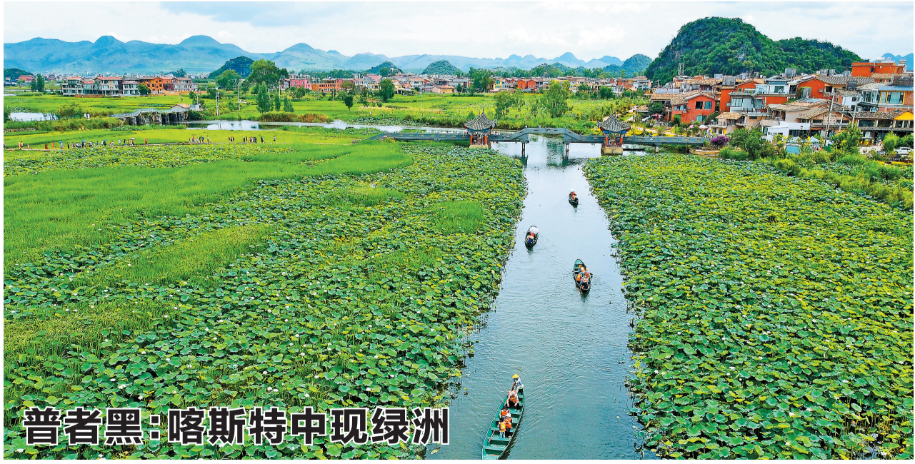
普者黑:喀斯特中现绿洲

关注森林活动是践行习近平生态文明思想的重要载体。1999年,由全国政协倡导,全国政协人口资源环境委员会等单位联合发起全国关注森林活动,动员全社会关心、支持和参与林业发展和生态建设。20年来,全国关注森林活动为推进生态文明建设发挥了重要作用。2020年1月,根据全国关注森林活动组委会部署要求,云南参照全国关注森林活动组织架构,成立云南关注森林活动组织机构。