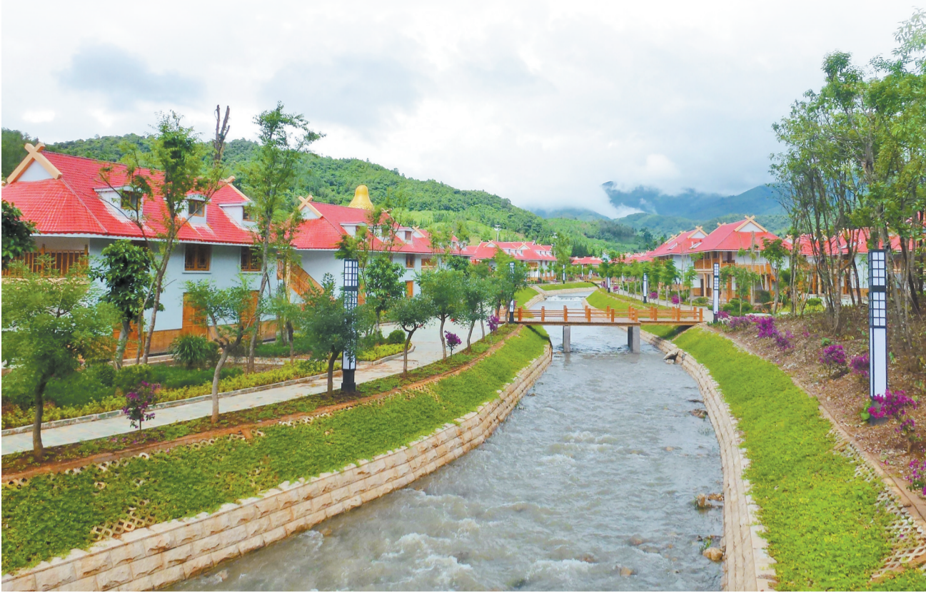
富有特色的沧源佤族自治县葫芦小镇

同时，“爱国卫生组织管理、健康教育与健康促进、市容环境卫生、环境保护、重点场所卫生、食品和生活饮用水安全、公共卫生与医疗服务、病媒生物预防控制”8个方面的全域创卫正在有力有效推进。