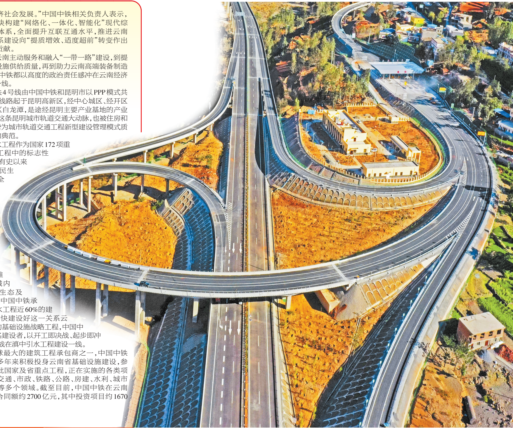
中国中铁投资建设并运营的东格高速

作为全球最大的建筑工程承包商之一，中国中铁及成员企业多年来积极投身云南省基础设施建设，参与修建了大批国家及省重点工程，正在实施的各类项目涉及轨道交通、市政、铁路、公路、房建、水利、城市综合体开发等多个领域。截至目前，中国中铁在云南省在建项目合同额约2700亿元，其中投资项目约1670亿元。