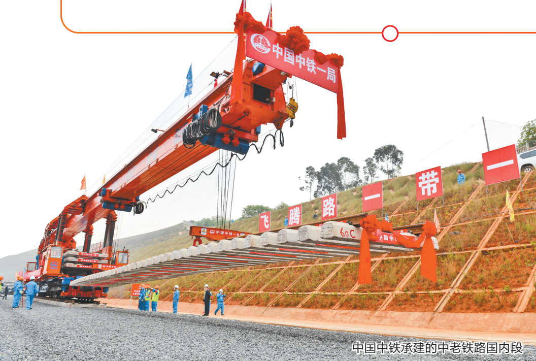
中国中铁承建的中老铁路国内段