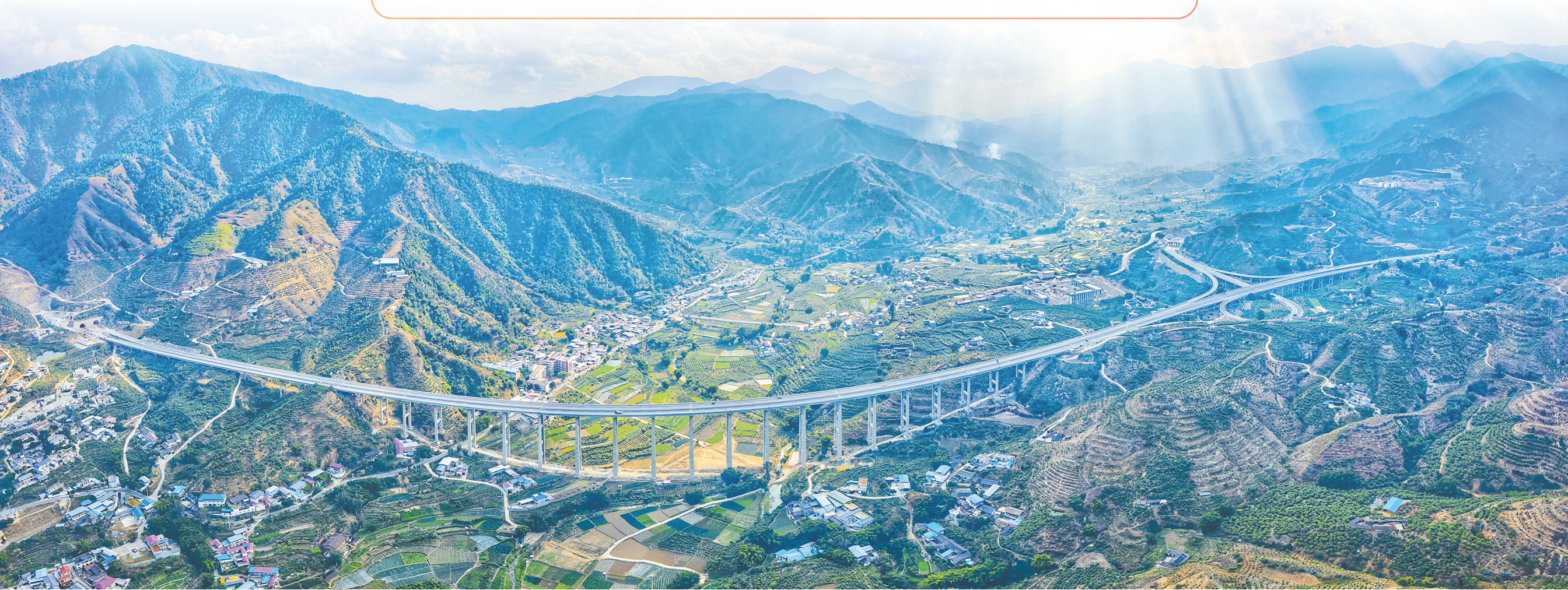
玉楚高速阿姑特大桥

发展坦途，大力推动中铁设计、中铁建造、中铁标准、中铁装备等全面“走出去”，全力助推云南建设面向南亚东南亚辐射中心，成为我国对外开放新高地。