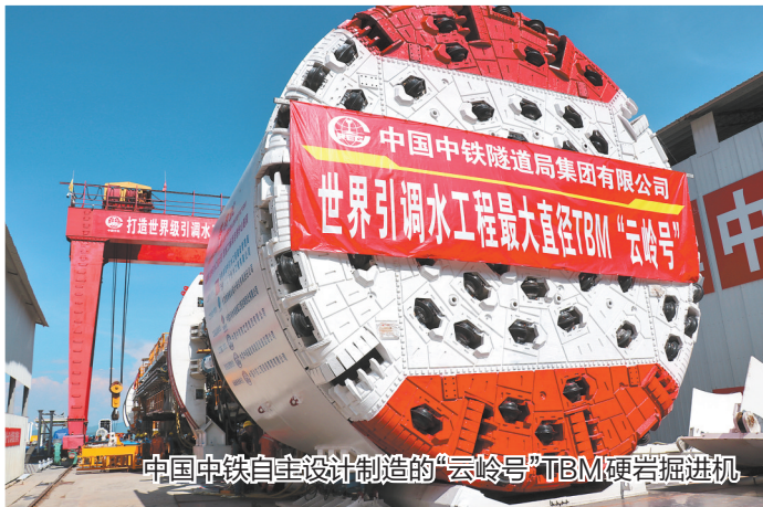
中国中铁自主设计制造的“云岭号”TBM硬岩掘进机

交通是制约云南经济社会发展的最大短板。长期以来，中国中铁充分发挥在工程设计、桥梁施工、隧道施工、工程装备制造等方面的优势，积极参与大瑞、玉磨、丽香、弥蒙、大临等铁路项目建设；投资近千亿元建设了昆明东格、寻沾、玉楚、勐绿等高速公路项目，总里程近600公里；全面参与了昆明市目前投入运营的5条轨道交通项目建设，建设里程近通车总里程的60%。