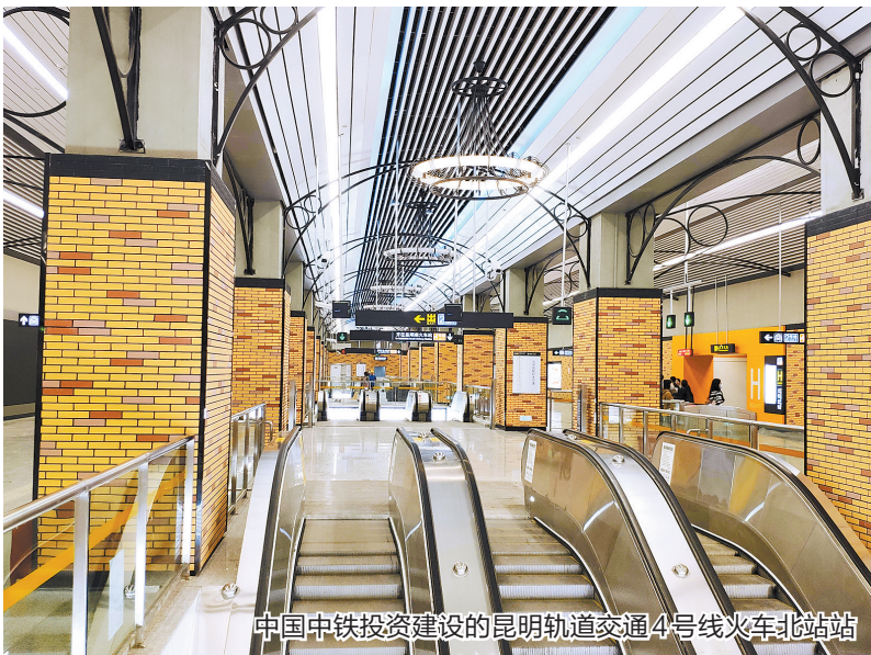
中国中铁投资建设的昆明轨道交通4号线火车北站站