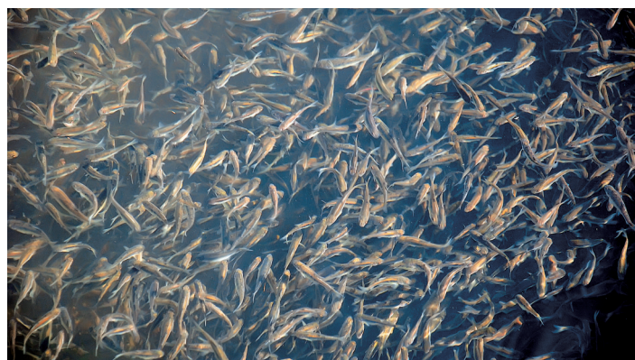
华能龙开口电站在云南首次繁殖岩厚鲤成功