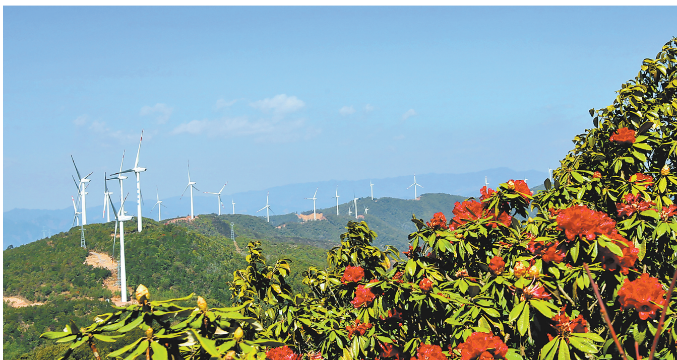
云南第一个数字化风电场——祥云野猫山风电场

小湾电站首开世界300米级拱坝建设先河、糯扎渡电站世界首创“数字大坝”管理技术、黄登电站建成亚洲最高碾压混凝土重力坝……扎根云岭大地以来，华能集团携手云南深化能源经济战略合作，加强绿色能源、绿色制造、节能环保等领域的务实合作，共同打造世界级绿色发展新高地。