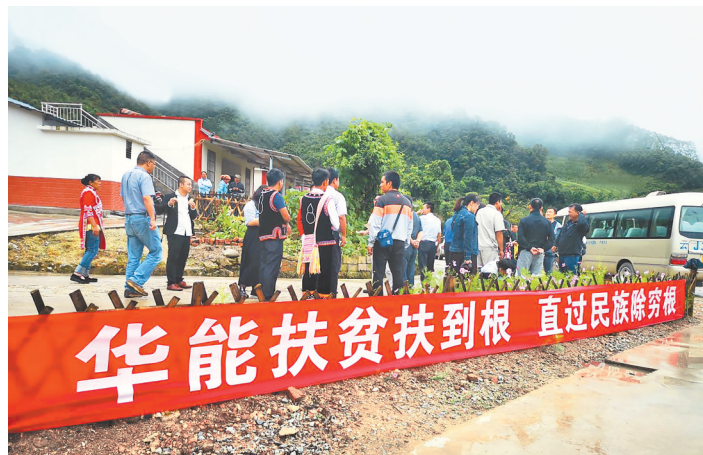
华能澜沧江公司帮扶澜沧县拉祜族群众脱贫