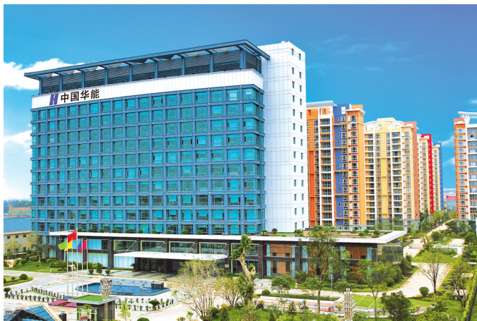
华能澜沧江公司大楼