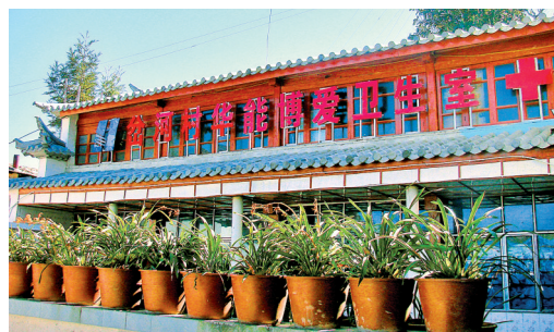
华能澜沧江公司在凤庆县援建的华能卫生室

华能澜沧江公司紧扣国家碳达峰、碳中和目标，在编制公司“十四五”规划中，将西藏澜沧江清洁能源基地、澜沧江云南段风光一体化可再生能源基地、曲靖风光煤电一体化清洁能源基地建设列入国家规划，助推国家新能源发展。“十四五”和今后一个时期，华能澜沧江公司发展将碳达峰、碳中和目标作为行动指南，以推动高质量绿色发展为主题，全力推进水电与新能源并重发展，努力建成世界一流现代化绿色电力企业。