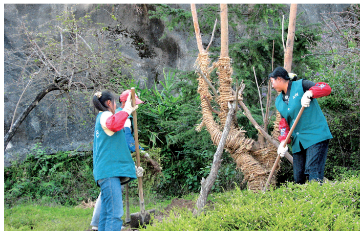
小湾电站设置区对国家二级保护植物进行移植