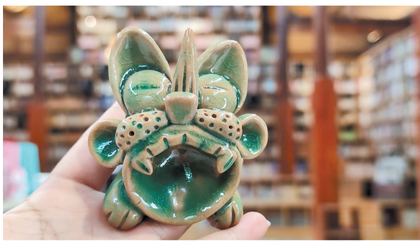
沙溪先锋白族书局的文创产品——瓦猫造型别致。

昆明商圈有百货,古镇市集也给游客带来惊喜。大理古城的变压工厂野蘑菇派对市集上,独立咖啡品牌 Gear Coffee、手工作坊的自制手工皮具、烧制陶艺工作室的作品,以及土布杯垫、