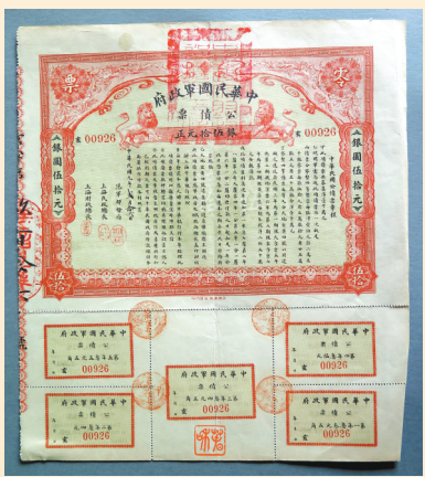
中华民国军政府 50元公债券