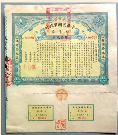
中华民国军政府 10元公债券

宣统三年（1911年）五月，李鸿祥被任命为七十三标第三营管带。1911年10月30日，正当李鸿祥所部在北校场分发武器准备起义时，为北洋系值队官唐元良发觉。所部士兵见事机败露，开枪击毙唐元良。李鸿祥即召集全营督师起义。七十三标“标统”（团级指挥官）率卫队前来镇压，李鸿祥率部奋勇迎头痛击。随后革命军蜂拥入城，围攻昆明五华山军械局巡防队，云南总督李经羲急调部队，与李鸿祥部在黄河巷一带巷战数小时。当夜3时，蔡锷率大队进城，炮击总督署和军械局。31日中午12时，革命军占领全城。两日后云南军都督府成立，蔡锷为都督，任命李鸿祥为省城卫戍司令。