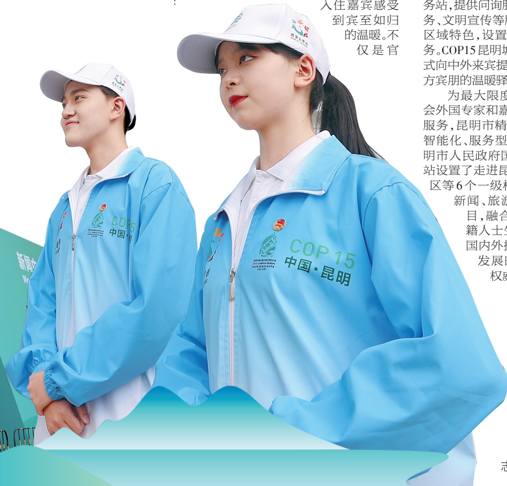
志愿者提供专业服务