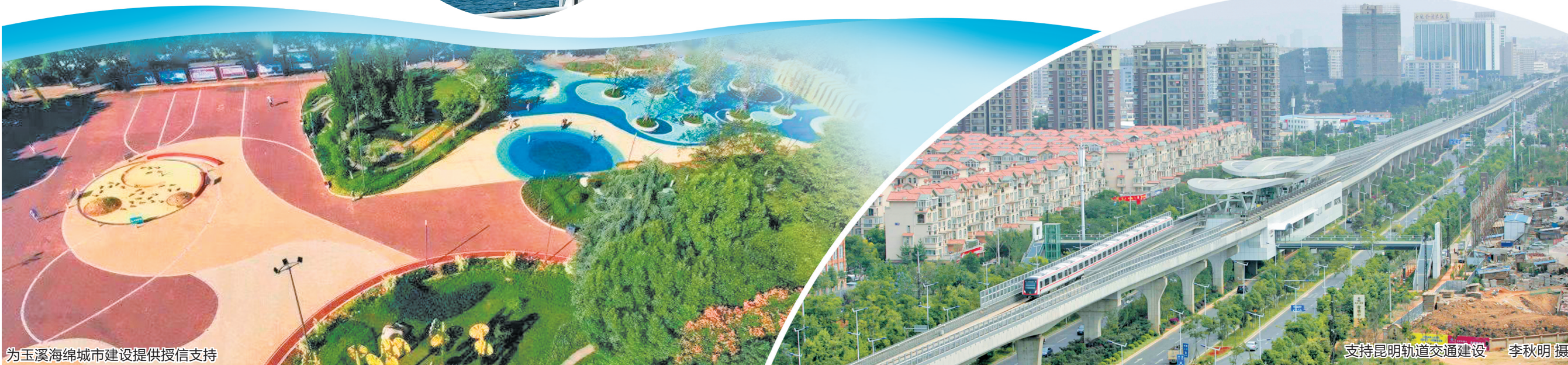
为玉溪海绵城市建设提供授信支持