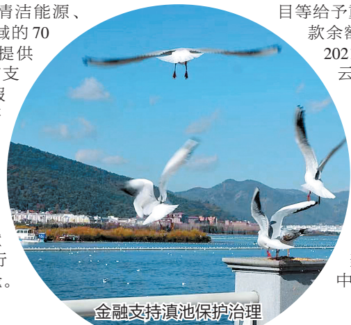
金融支持滇池保护治理

截至目前，中国银行在云南为环保、节能、清洁能源、绿色交通等领域的70余个绿色项目提供近230亿元授信支持，为云南绿色发展的“三张牌”、推动高质量发展贡献了源自中国银行的强大金融力量。