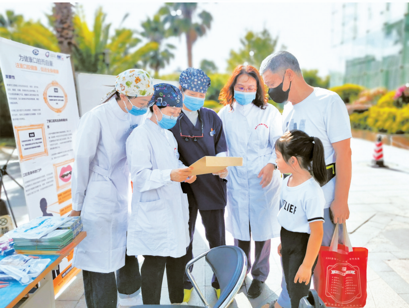
宣传口腔保健知识

习得临床岗位技能是一名口腔科医生成长的根基,而这阶段的能力塑造依赖于是否有强大的教学型医院作为支撑。随着口腔医学发展和学科专业的细化,除了在课堂教学中注重理论知识的更新,医院还针对临床教学的实践,持续推进口腔医学高等教育模式改革,通过建设国家级大学生校外实践教学基地以及云南省口腔医学重点实验室,提高医院医教研整体水平,打造“产学研一体化”的教学型和研究型医院。“以教促医、以医促教、以医促研”最大限度地发挥医院和高校的凝聚作用,大幅提升医院人才培养水平。