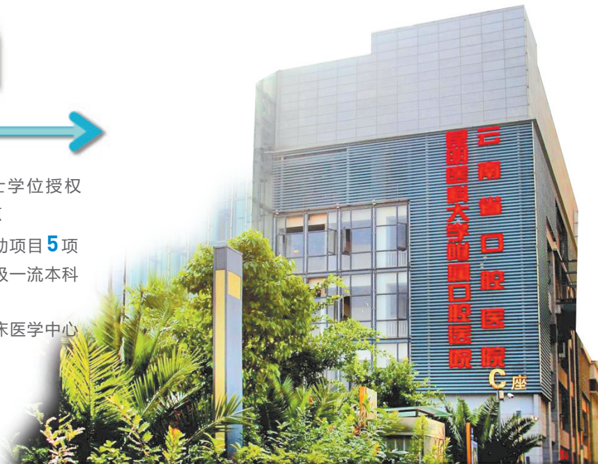
昆明医科大学附属口腔医院(本部)门诊大楼