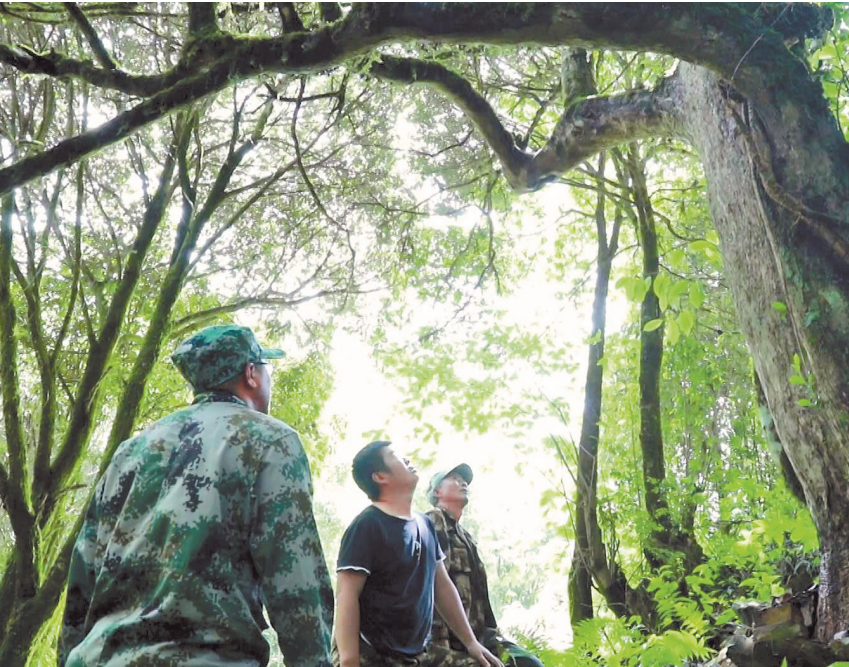
护林员在善洲林场开展资源调查

月雨季植树造林开始，他每天带着至少30名工人进行树苗移栽，最多的时候有200名工人，最远的地方要用马帮驮着树苗，沿着山洼小路步行18公里，走到施甸县酒房乡的干沙坝。