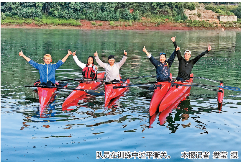
队员在训练中过平衡关。

全国第十一届残运会暨第八届特奥会皮划艇、赛艇比赛已全部结束，我省残疾人皮划艇、赛艇队的成绩让人震惊：他们首次参赛，就获得了10金2银3铜的优异成绩。