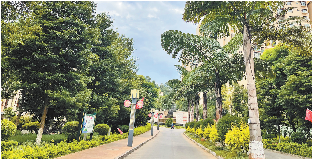
党员报到助力人居环境提升。

“社区吹哨、党员报到”“人为社区 社区为人人”“报到身到 服务心到”，玉溪市红塔区常态化、制度化推动“双报到双服务双报告”工作，探索区属机关企事业单位党组织、在职党员服务好群众的路径，连接起党员干部联系群众的纽带，把工作做到实处，把实事办到群众心坎上，共建共治共享城市基层治理格局。