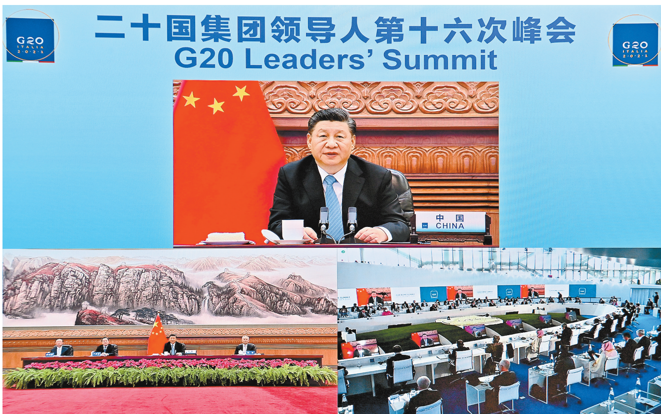
10月31日晚，国家主席习近平在北京继续以视频方式出席二十国集团领导人第十六次峰会。