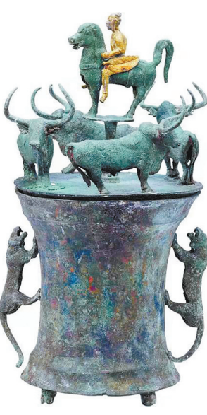
四牛鎏金骑士铜贮贝器