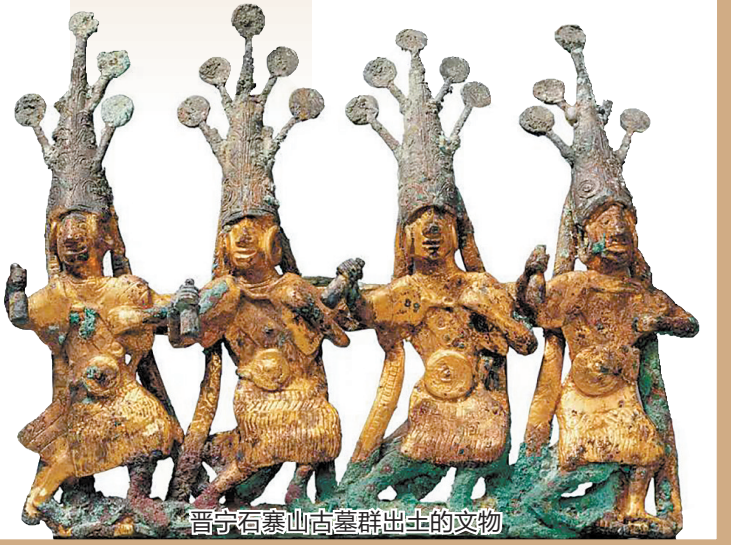
晋宁石寨山古墓群出土的文物