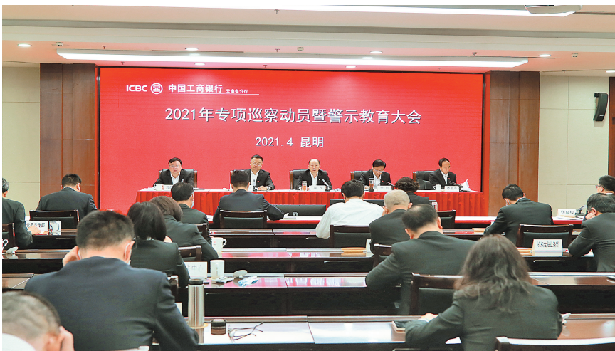
工商银行省分行召开2021年专项巡察动员暨警示教育大会

进一步完善管理人员廉洁从业承诺和报告制度、廉洁履职责任制度、廉洁风险防控制度等,将防止利益冲突、规范透明等清廉文化理念贯穿其中,推动清廉文化在经营管理各领域、各环节的渗透,形成系统完整、科学合理、程序严密、制约有效的专业制度体