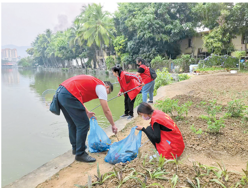
党员志愿者清理垃圾