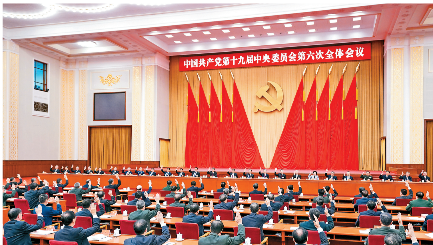
中国共产党第十九届中央委员会第六次全体会议,于2021年11月8日至11日在北京举行。中央政治局主持会议。