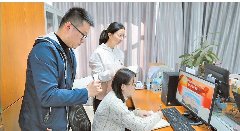
官渡区纪检监察干部认真学习党的十九届六中全会精神,领悟精髓要义,践行初心使命。