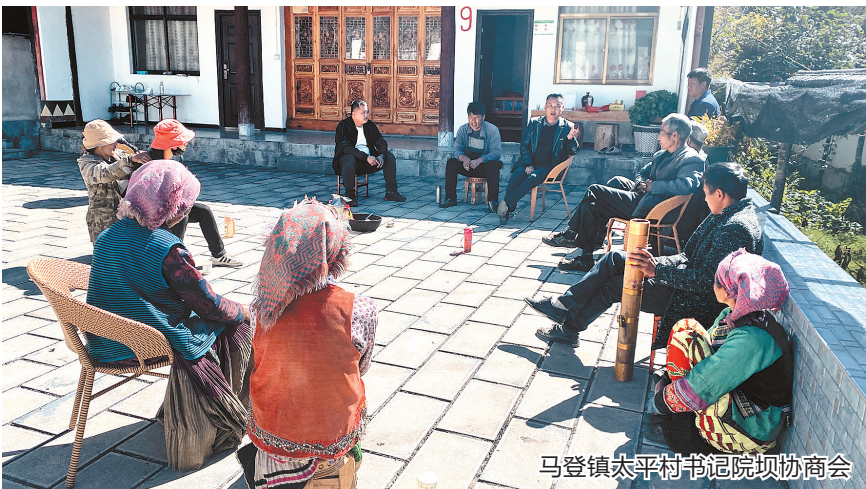
马登镇太平村书记院坝协商会

江南村村庄大扫除方案因群众意见不统一，群众参与度低。今年村党总支书记在书记院坝协商会上向群众讲政策、讨