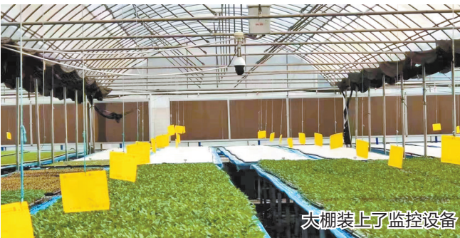
大棚装上了监控设备

整合电信安全云资源，依托功能强大的视频监控平台和专业的本地服务团队，持续为数字乡村建设工作保驾护航。