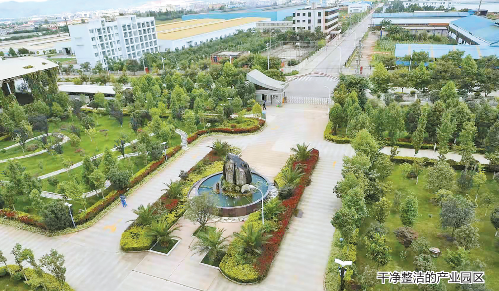
干净整洁的产业园区

杨林经开区以商招商实现了地方、代招商企业和新招入企业三方共赢的目标。产业集群的形成发展了地方经济，做大了代招商企业发展规模，扩大了新入驻企业发展空间，开创了优势互补、资源共享、发展共赢的产业布局局面。