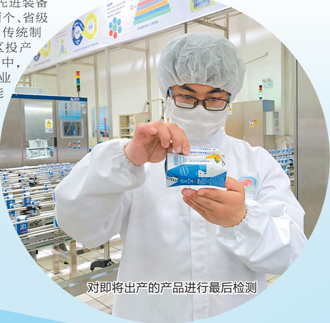
对即将出产品进行最后检测

据介绍，杨林经开区加快培育以汽车制造及零部件配套、数控机床为主的先进装备制造基地建设，拥有国家级产业基地两个、省级产业基地4个，主导产业更加明晰，传统制造向现代制造转型升级。目前，园区投产企业300户，规模以上企业76户，其中，世界500强企业8户、中国500强企业11户，汽车产业园成为全省首个新能源汽车产业园，总规划面积18.58平方公里，远景规划整车产能80万辆/年，入驻以“三整车一中心”为代表的汽车制造及配套企业7家，新能源汽车产业驶入千亿产业发展快车道。预计到2025年，新能源汽车年产能力将达到一定规模。