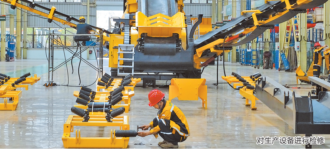
对生产设备进行检修

在发展绿色食品产业过程中，杨林经开区严格落实《云南省牛栏江保护条例》，着力实施绿色制造行动和循环化改造示范试点，成功创建为省级绿色园区。2020年，园区有50户工业企业通过了清洁生产审核验收，13家企业通过了ISO14001环境管理体系认证。组织实施天然气（CNG）母站、天然气杨林门站已投产通气，实施园区节水循环化工程，建成总容量1.5万立方米中水回用收集池3个，建成中水回用管道约80公里，建成日处理污水2万立方米的污水处理厂1座，建成雨污管网约134公里，中水出水水质持续稳定达标，实现园区污水全收集、全处理、全回用。