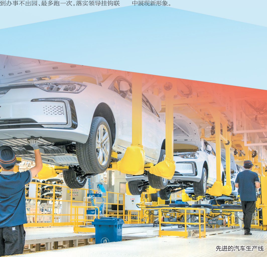
先进的汽车生产线