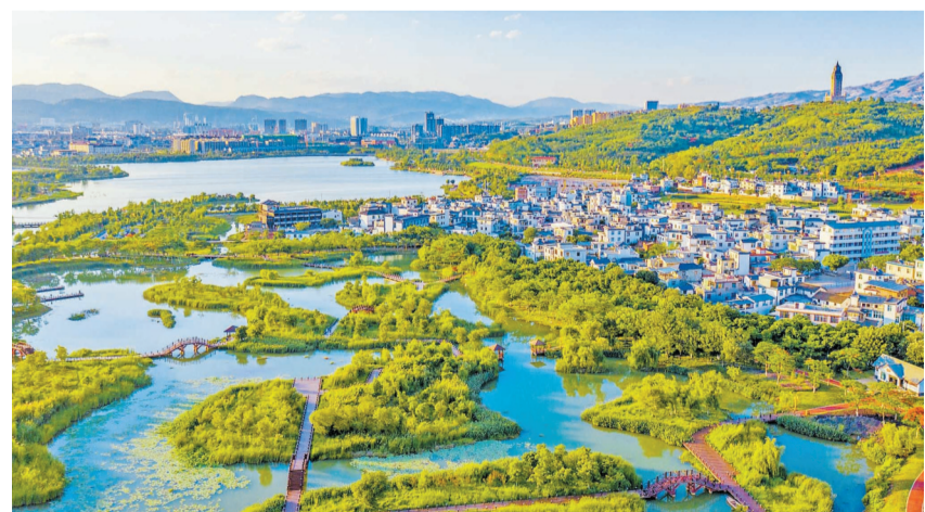
仁者村远眺

本报(记者 殷洁)自人居环境整治工作开展以来,开远市严守农村人居环境标准,瞄准“美丽乡村”创建,聚焦农村“厕所革命”、生活垃圾治理、生活污水治理、村容村貌提升、村庄规划与管理、建立完善长效管护机制6项重点工作,系统推进农村人居环境整治提升。