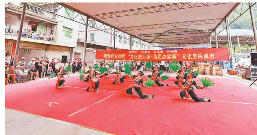
民族传统歌舞表演

本报(记者 饶勇 通讯员 龙秀梅)今年以来,绿春县聚焦“党建聚力·文旅凝心”主题,坚持党建引领思路,将文旅元素与党建项目有机衔接,助力文旅融合发展。