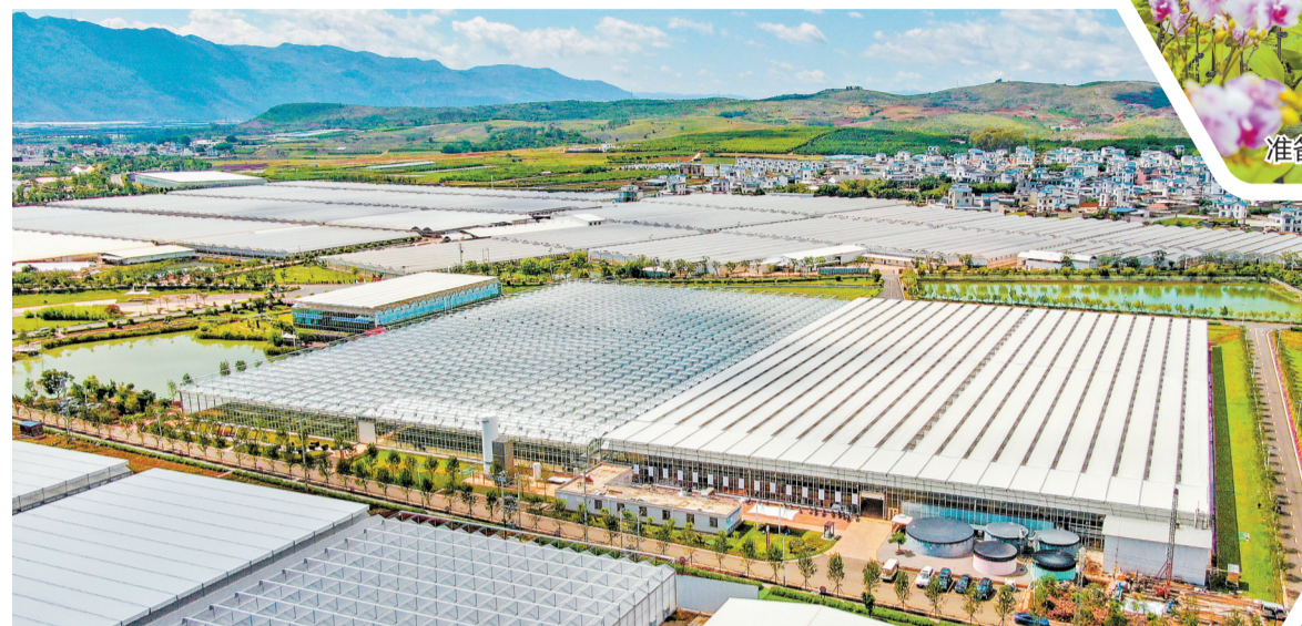
开远高效现代农业产业园一角

近年来,开远市推动数字化转型,积极打造数字乡村,加强新型智慧城乡建设,推进数字基础设施共建共享,打造智慧化应用场景,助力乡村振兴和现代化新农村建设。