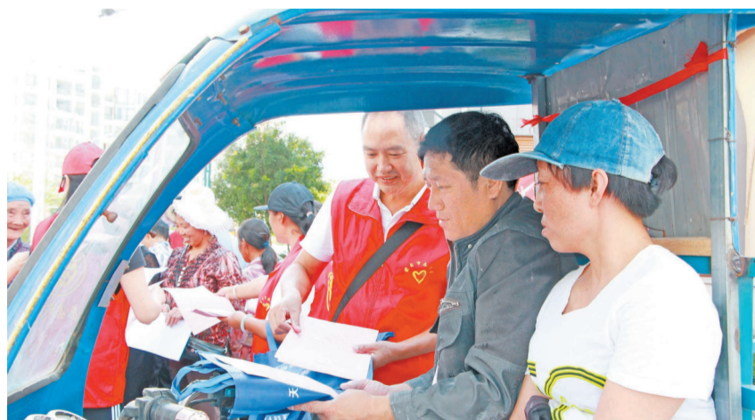
志愿者向市民普及创文知识 供图

本报(记者 黄翥楚 通讯员 王爱菊 李雪蕾)今年以来,蒙自市把学雷锋志愿服务活动作为全市培育和践行社会主义核心价值观、推进全国文明城市创建的有效载体,组织志愿者开展文明交通劝导、环境卫生整治等形式多样的志愿服务活动,帮助群众解决所需所盼。