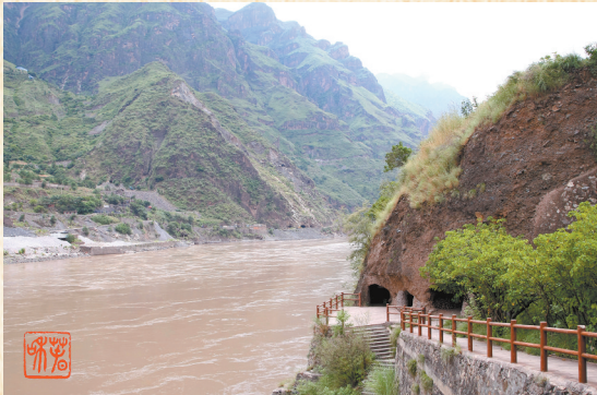
红军渡江遗址:毛泽东、周恩来、朱德等领导人的宿营地

1935年5月1日,正是石榴花开的时节,中央红军军委纵队从小甸村渡出发,经禄劝九龙进入翠华小仓。毛泽东在界碑小村三间瓦房、院里开着石榴花的汪姓人家住宿。红军干部战士利用宿营时间,与群众促膝谈心。一位老大娘问红军:“来了这么多人,天下是不是要太平了?”红军说:“就是要太平了,红军是来帮助穷农民打富济贫的。”老大娘情不自禁唱起了《榴花歌》:“石榴花开叶子青,穷人只爱一个人。沧海桑田永不变,人生路上不回头。石榴花开叶子青,穷人对你下决心。今生今世永不变,榴花红艳映山河……”这首《榴花歌》,至今仍传在金沙江畔传唱。