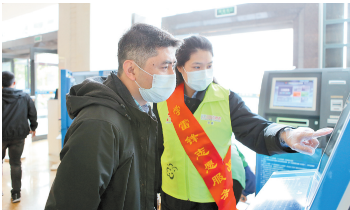
指导纳税人操作纳税终端设备