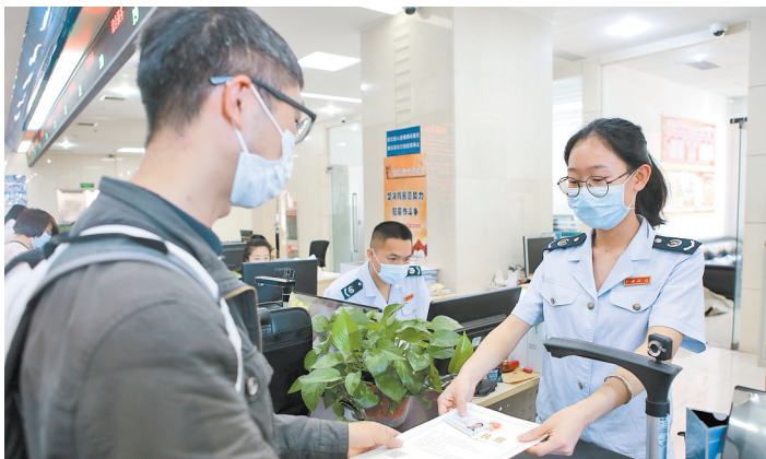
为纳税人办理业务