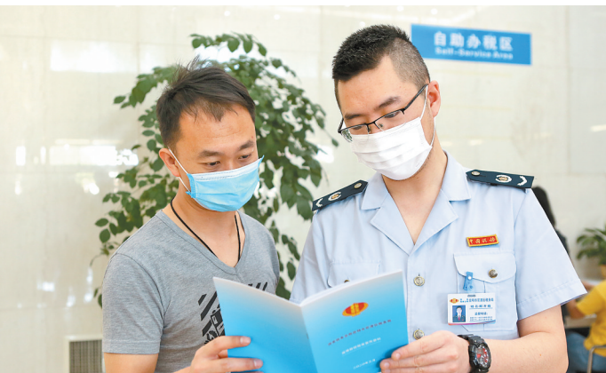
向纳税人宣传税法