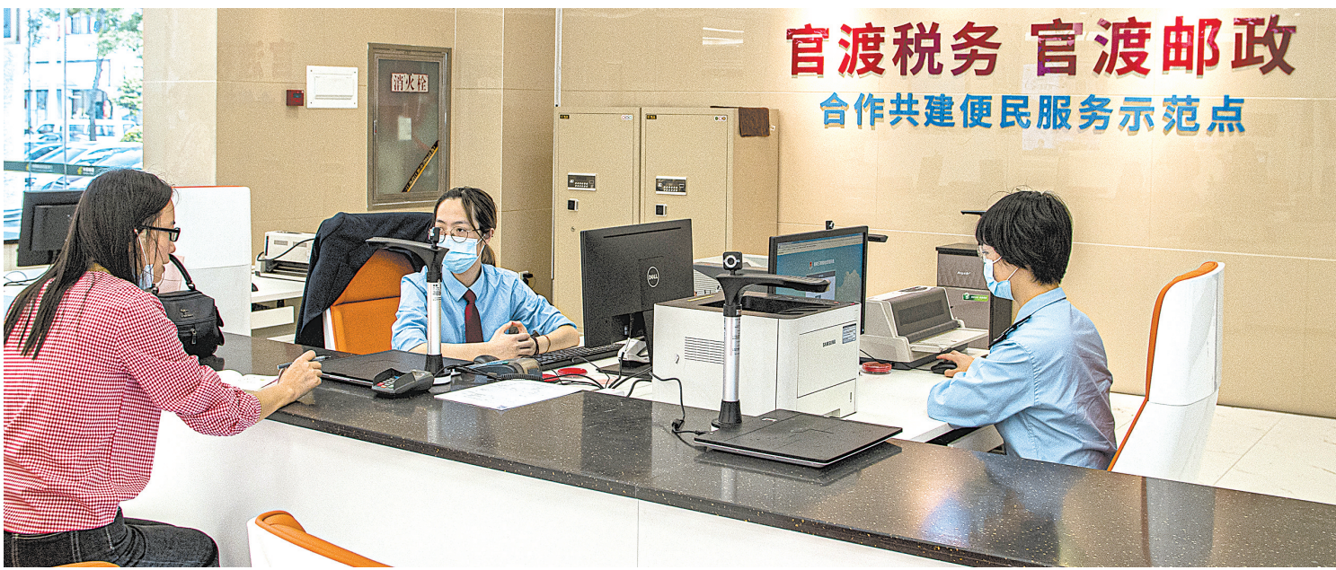
税邮合作便民服务示范点