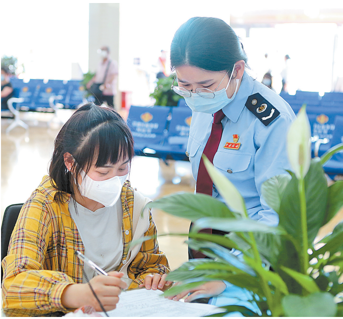
指导纳税人填报资料