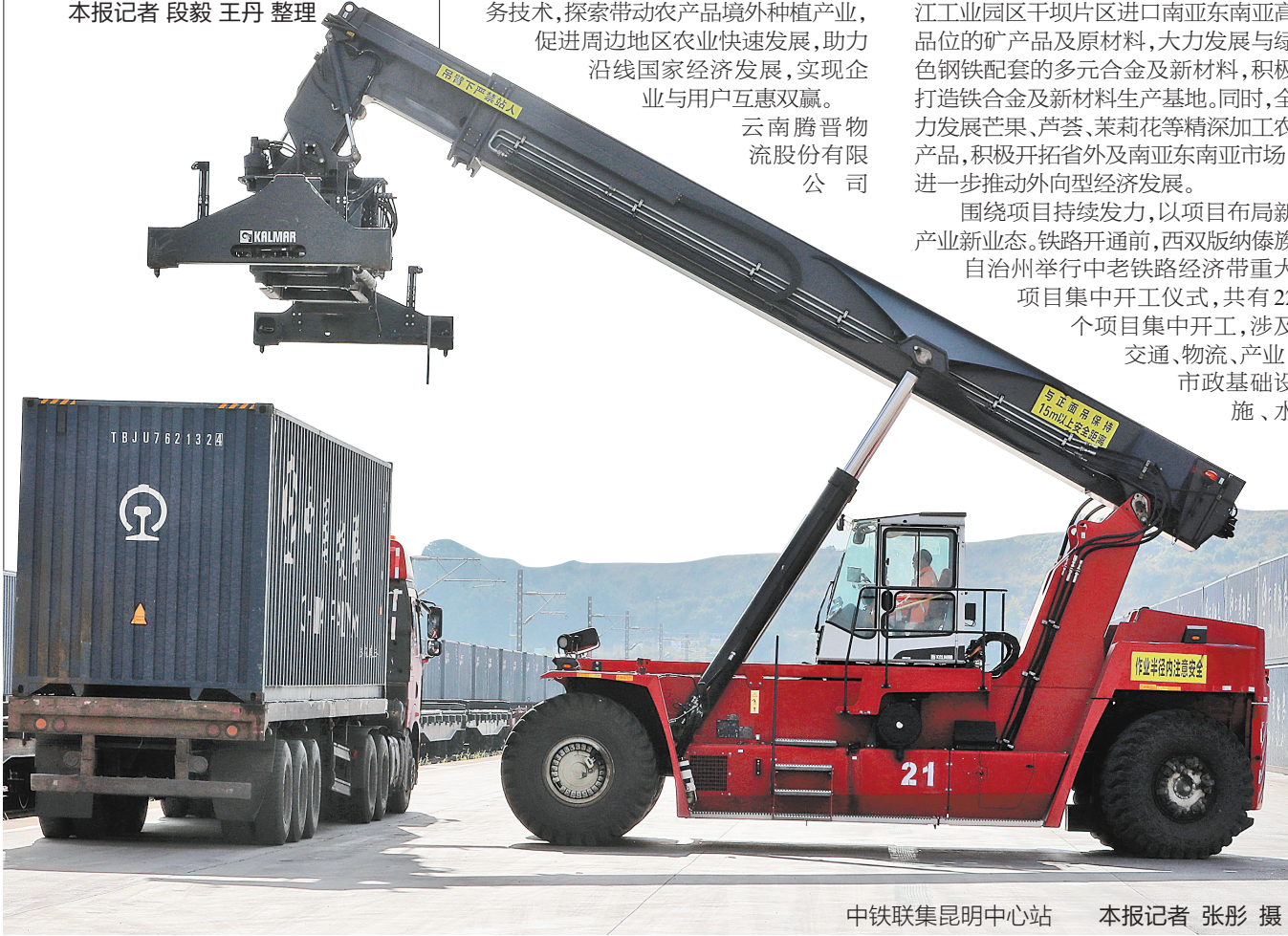
中铁联集昆明中心站

2021年12月16日,国家发展改革委政研室副主任兼国家发改委新闻发言人孟玮表示,中老铁路通车后,与泰国米轨相连接,泛亚铁路中通道初步打通,中南半岛国家可通过中老铁路到达中国市场,通过中欧班列可进一步抵达欧洲市场。