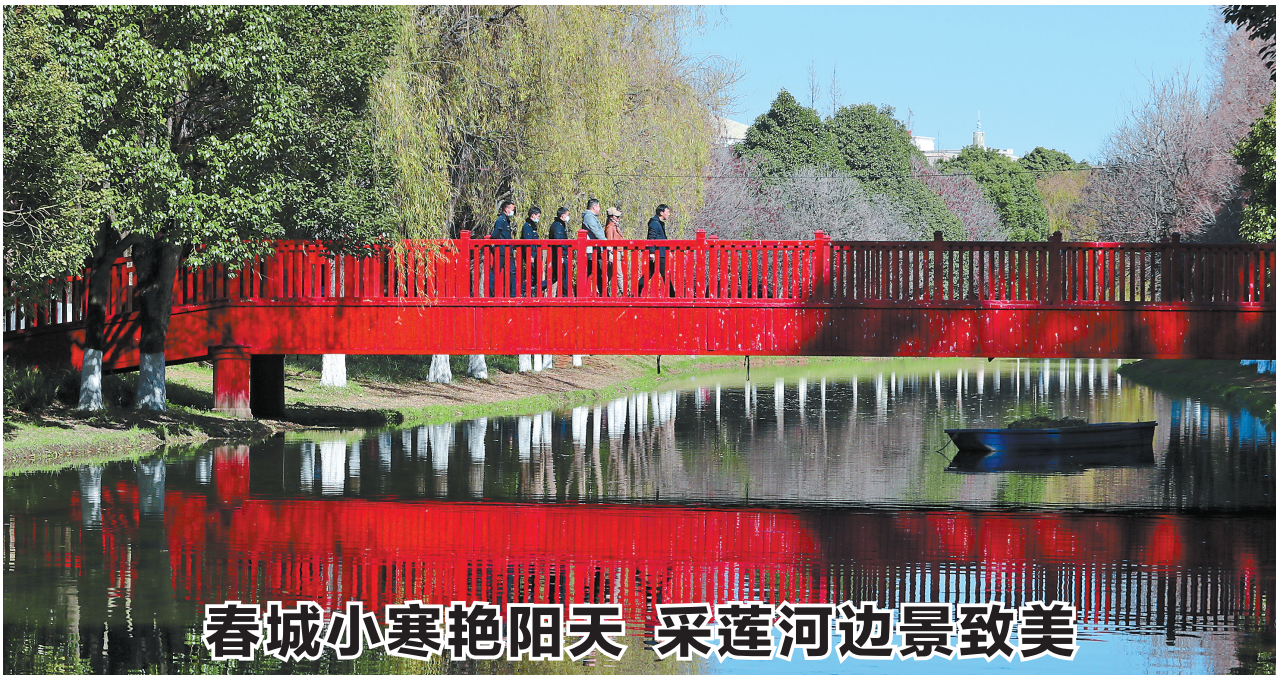
春城小寒艳阳天 采莲河边景致美

为配合《壬寅年》生肖邮票的首发,中国邮政云南分公司举办了“一虎百福,福邮万家”2022年云南邮政集邮生肖嘉年华活动,重点推出《虎年生肖嘉年华》珍藏册,产品内含第一、二、三、四轮生肖套票、第一轮虎流通纪念币1枚、第二轮虎流通纪念币1枚(发行后赠送)、敦煌虎符金钞1枚(0.08克),产品限量发售。