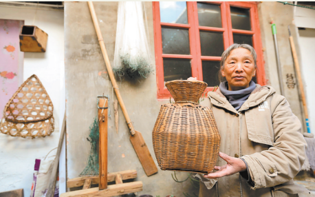
昔日渔具成纪念品