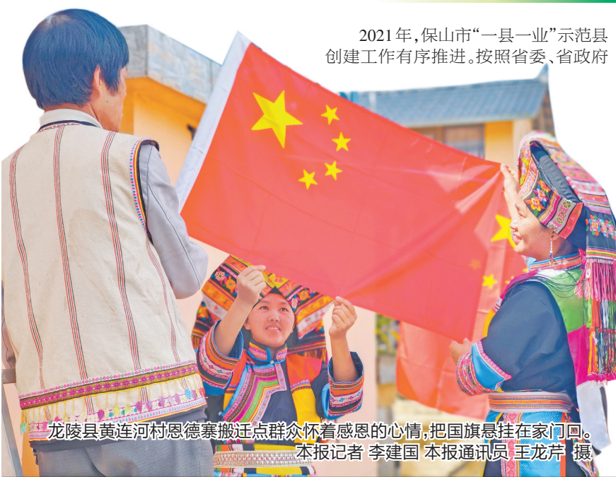
龙陵县黄连河村恩德寨搬迁点群众怀着感恩的心情,把国旗悬挂在家门口。

2021年是“十四五”开局之年,也是做好巩固拓展脱贫攻坚成果同乡村振兴有效衔接的第一年。在保山,从杨善洲故里施甸到滇西雨屏龙陵,从千年茶乡昌宁到极边第一城腾冲,从富饶美丽的潞江坝到澜沧江畔的小山村,一支支乡村振兴工作队接力出发,一个个特色产业带动高质量发展,一项项乡村建设规划先后落地。农村人居环境持续改善、经济社会和谐稳定、人民群众幸福安康,保山市全面推进乡村振兴步履铿锵。