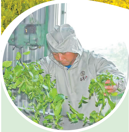
鲜茶叶加工

2021年是“十四五”开局之年,也是做好巩固拓展脱贫攻坚成果同乡村振兴有效衔接的第一年。在保山,从杨善洲故里施甸到滇西雨屏龙陵,从千年茶乡昌宁到极边第一城腾冲,从富饶美丽的潞江坝到澜沧江畔的小山村,一支支乡村振兴工作队接力出发,一个个特色产业带动高质量发展,一项项乡村建设规划先后落地。农村人居环境持续改善、经济社会和谐稳定、人民群众幸福安康,保山市全面推进乡村振兴步履铿锵。