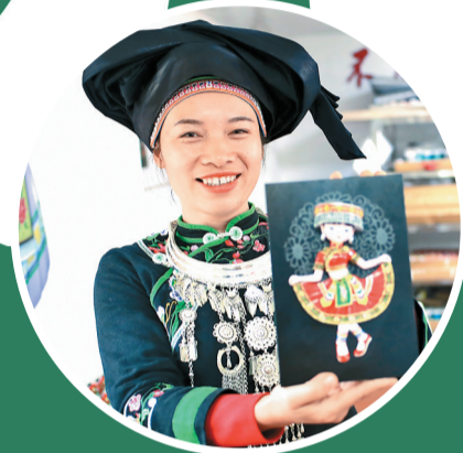
西畴县西洒镇文创新车间壮族群众制作的玩偶