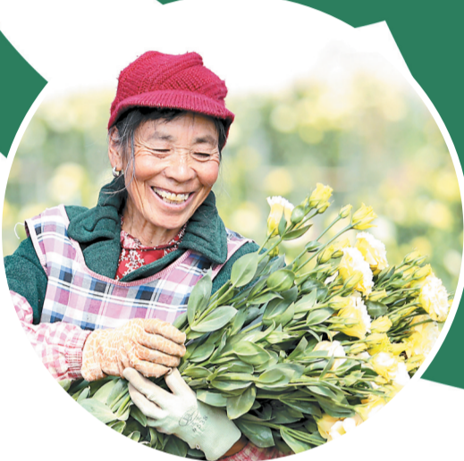
姚安县官屯镇官屯社区大力发展花卉产业