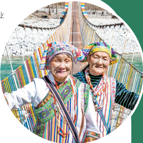
贡山县独龙族群众脸上洋溢着幸福的笑容

花在巡山护林护边的间隙,带头学习黄精、葛根、重楼、养蜂种养技术,让气候严寒,难以依靠草果致富的熊当小组有了新的增收门路。