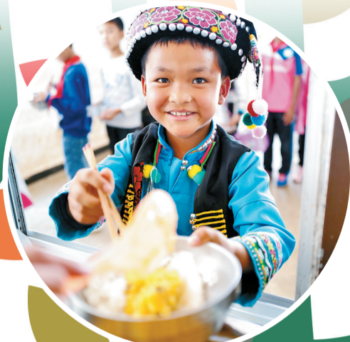
施甸县木老元乡的布朗族学生吃上可口的饭菜