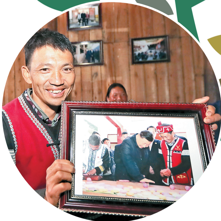
腾冲市司莫拉佤族村村民李发顺珍藏的与习近平总书记的合影照片