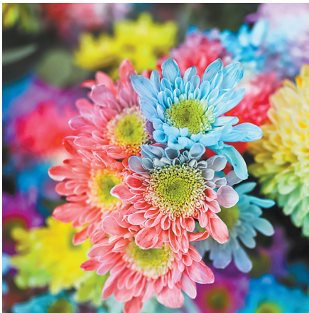
七彩云菊

在“十四五”开局起步的关键时期,这场观念觉醒、革故鼎新的思想碰撞,担当作为、拓展新局的实践活动,提振精神、比学赶超的作风比拼,让“今天再晚也是早,明天再早也是晚”的效率意识深入人心。全州广大党员干部以“等不起”的紧迫感、“慢不得”的危机感、“坐不住”的责任感,务实高效抓落实、迎难而上促发展,奋力在新时代的赶考路上交出优异答卷。