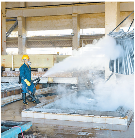
蒙自工业企业生产车间

岁末年初,天气转凉,但在红河州行政中心的各个办公室内却是一派繁忙景象。各部门立足主责主业,聚焦担当实干争先跨越的主题,围绕“七论七破七提升”,真讨论、较真劲,充分发挥刀刃向内、向内的精神,深入查找自身存在的问题与不足,扫清发展前行障碍,推进各自领域工作取得新成效新突破。