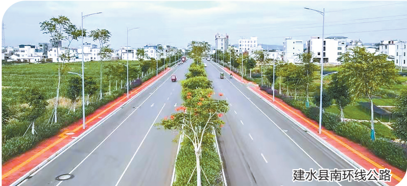
建水县南环线公路