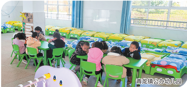
青龙镇公办幼儿园