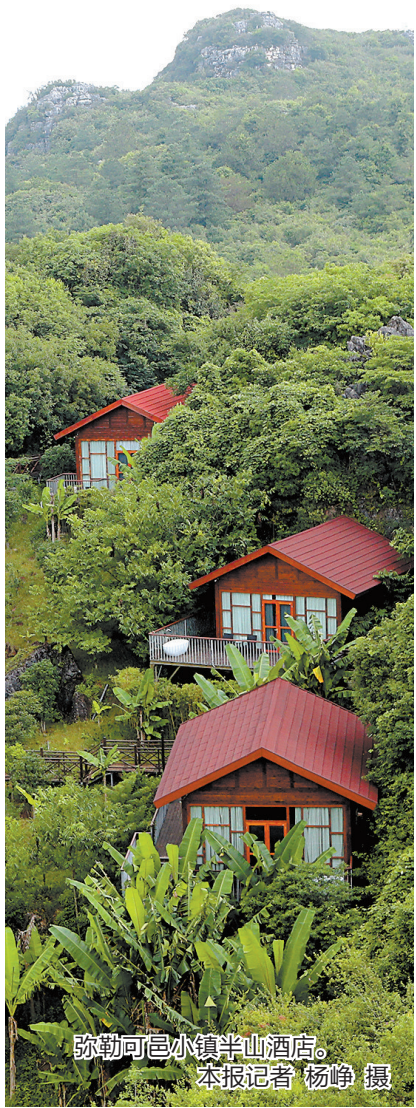
弥勒可邑小镇半山酒店。