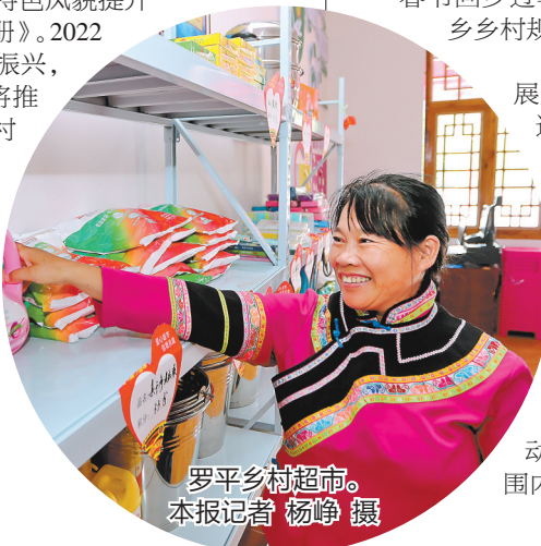
罗平乡村超市。

为留住乡愁，守住村落特色，保护好传统村落和传统民居，避免“千村一面”，2021年，省住建厅强化乡村建设风貌引导管控，指导各地结合地方民居种类、特色等，编制民居设计图集免费提供给农户使用。在实施农村危房改造的过程中编制了《云南省特色民居设计图集》《云南省民居特色风貌提升改造引导图册》。2022年，接续乡村振兴，住建部门还将推广《云南省乡村宜居农房风貌引导图集(乡村振兴版)》，指导各地编制民居设计图集免费提供给农户使用。