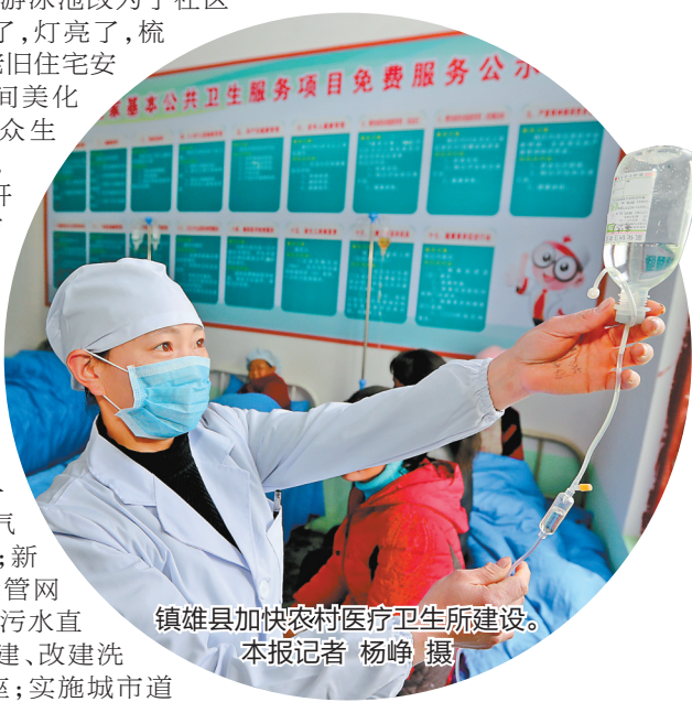
镇雄县加快农村医疗卫生所建设。

协同推进乡村振兴战略和新型城镇化战略，加快建立城乡融合发展体制机制，美丽乡村建设成效显著，城镇化质量明显提高，云南步入新型城镇化发展的快车道。