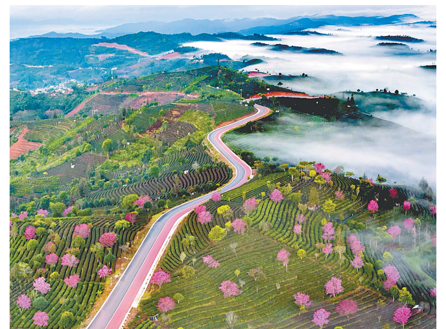
中华普洱茶博览苑