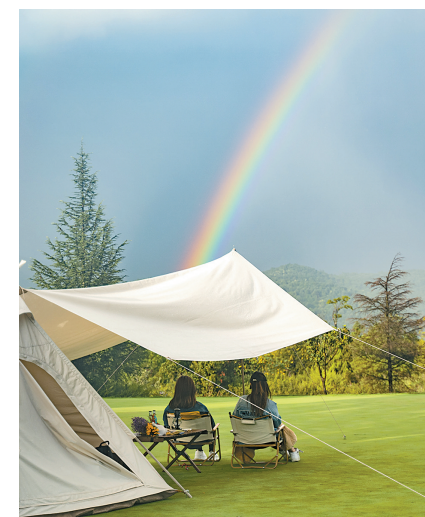
露营爱好者在露营