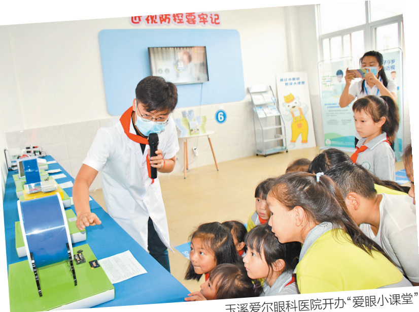
玉溪爱尔眼科医院开办“爱眼小课堂”