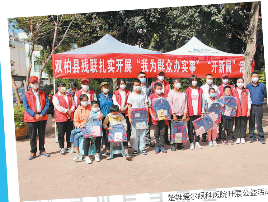
楚雄爱尔眼科医院开展公益活动