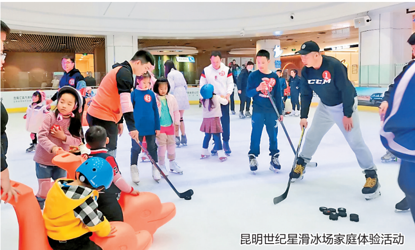
昆明世纪星滑冰场家庭体验活动

帷幕。活动吸引了80个家庭的160多人参与,冬奥知识问答、冰上拔河、冰上接力、冰上射门等一系列游戏,让大人和孩子乐在其中。据了解,我省从2019年以后就大规模地开展冰雪运动推广普及活动,许多冰雪场馆从刚开业时年度接待量仅有上千人次,到现在的年度接待量达数万人次。