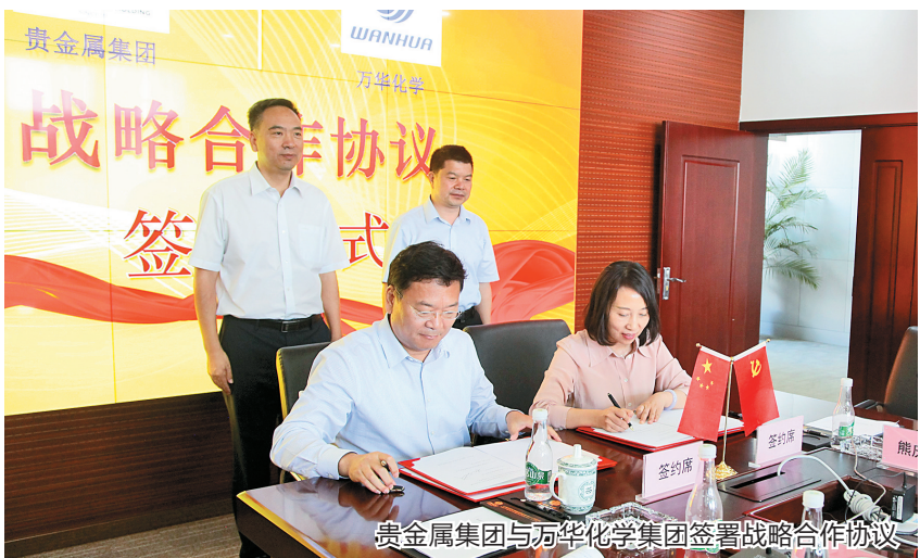
贵金属集团与万华化学集团签署战略合作协议