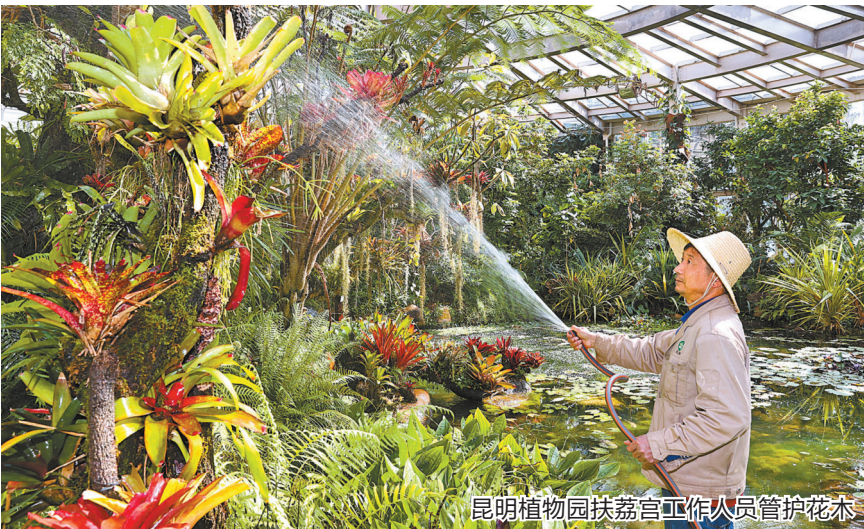
昆明植物园扶荔宫工作人员管护花木