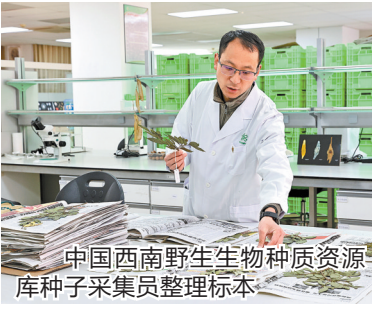
中国西南野生生物种质资源库种子采集员整理标本