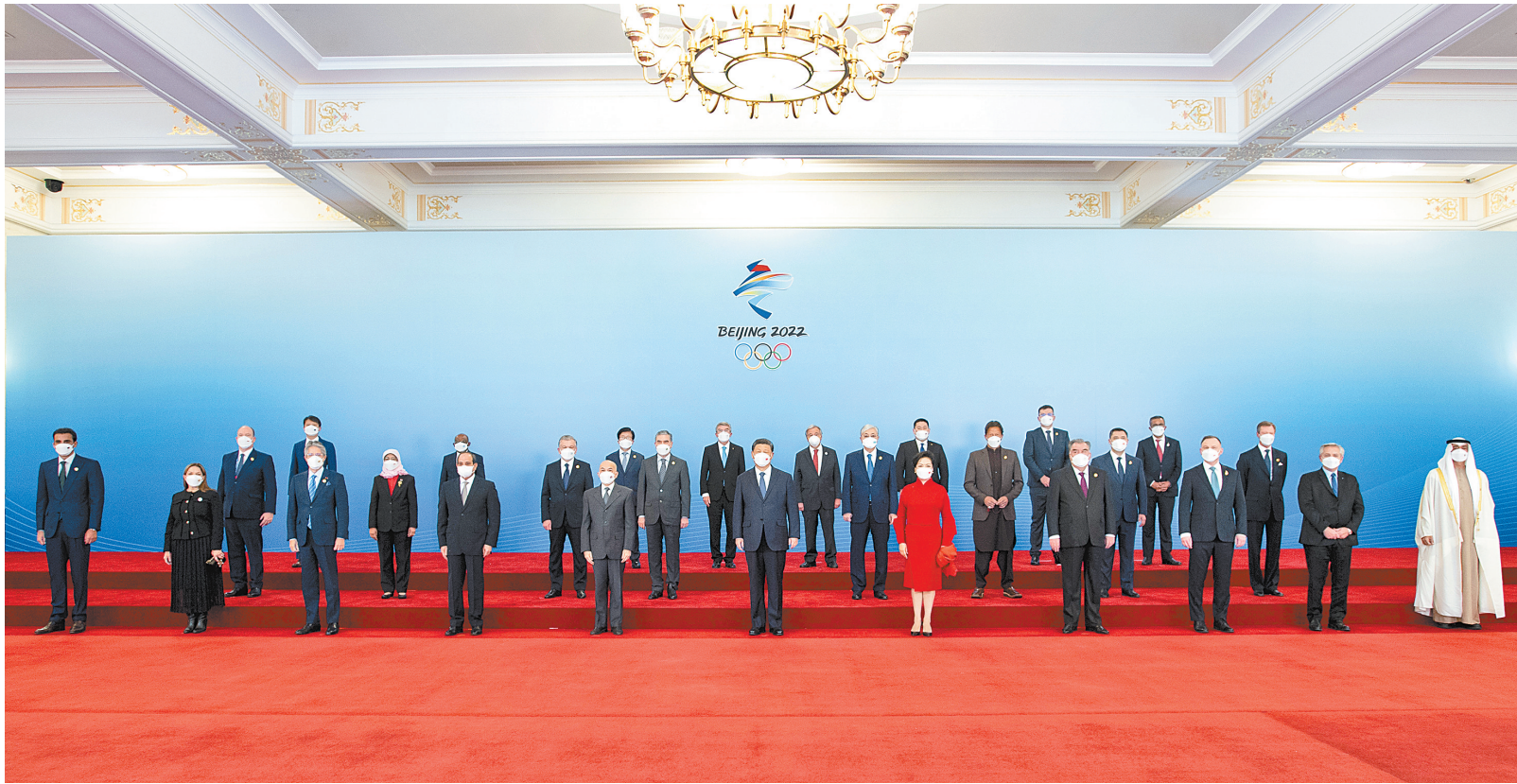
2月5日中午，国家主席习近平和夫人彭丽媛在北京人民大会堂金色大厅举行宴会，欢迎出席北京2022年冬奥会开幕式的国际贵宾。这是习近平和彭丽媛同国际贵宾一起合影留念。